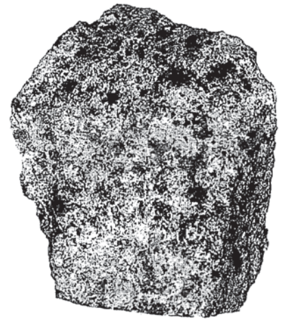
Fig 2.- Fragmento del meteorito de 'Cabezo de Mayo' conservado en el MNCN. Escala: 1 cm.