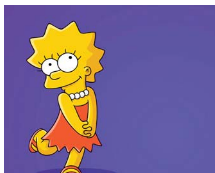
■ Lisa Simpsons