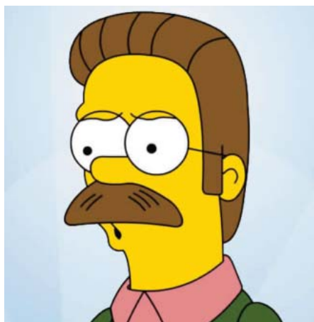
■ Ned Flanders

Por ejemplo, es posible observar que «Los Simpsons» abundan en situaciones donde entran en juego principios y valores a la hora de actuar o decidir y donde la tendencia de sus personajes es a obrar según las circunstancias del momento o según su propia conveniencia más que responder a una línea fija de conducta. Es el caso de Homero, el padre, que no trepida en hacer promesas a su familia, que por supuesto incumple o justificar actitudes inmaduras de las maneras más absurdas y ridículas. En ningún caso podría este progenitor obrar como modelo de conducta para sus hijos en la vida real o aportarles estabilidad emocional. Pues bien, en el caso de esta familia animada las situaciones logran ser corregidas al finalizar cada capítulo y nos dejan la sensación de un fi-