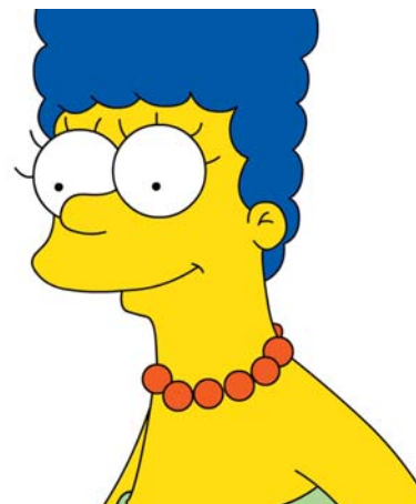
■ Marge Simpsons