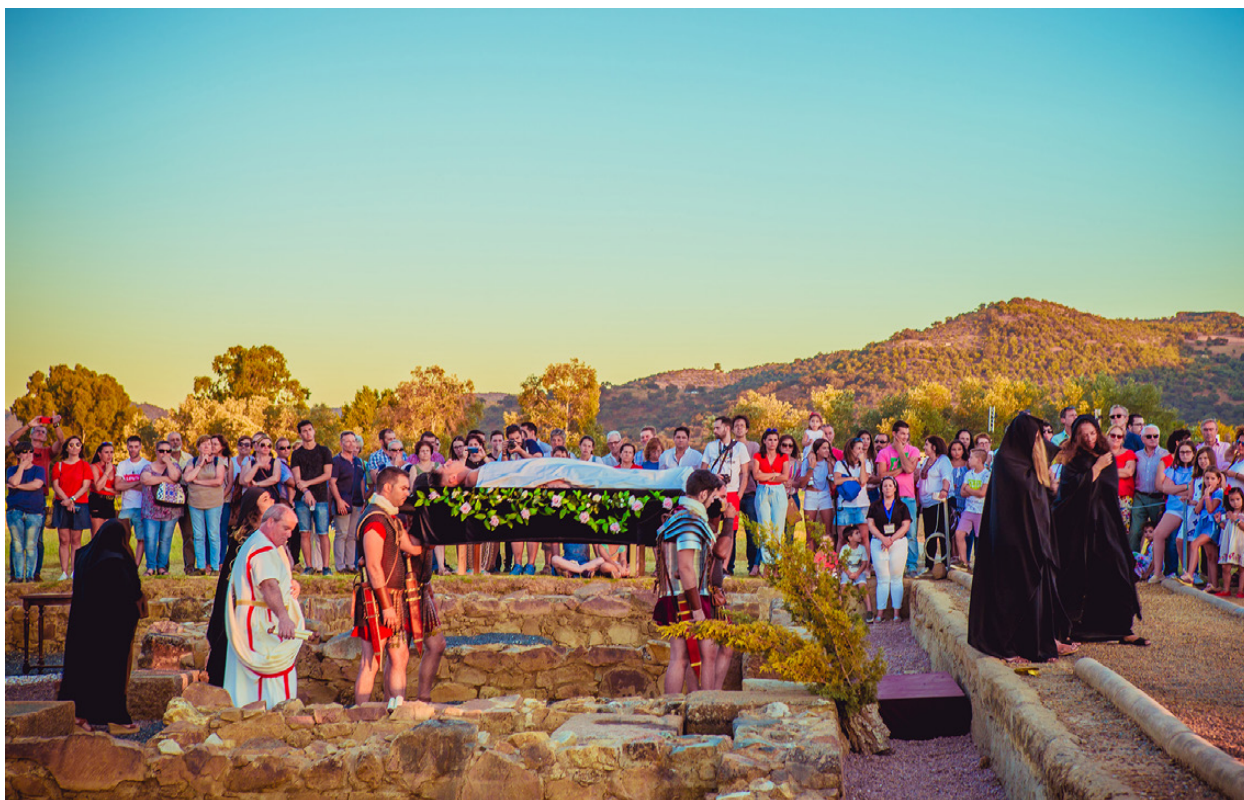
Figura 4. Recreación del funus romano durante el Festival de Diana.

enorme proyección social, ninguna de las actividades que hemos podido analizar se acerca al rico mundo funerario que posee esta ciudad.