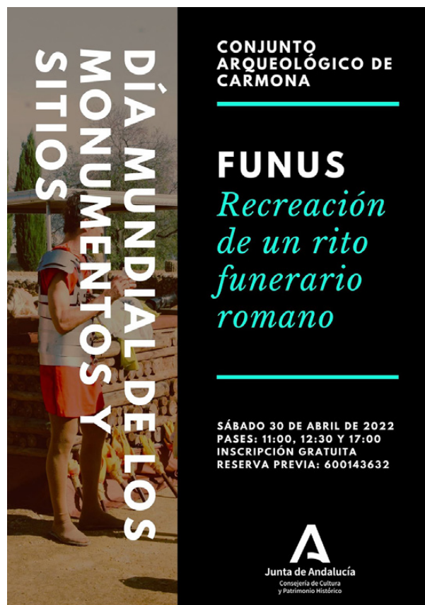
Figura 1. Cartel de una de las actividades funerarias realizadas en Carmona (Facebook @Conjunto Arqueológico de Carmona)

Al margen de estas actividades que se enmarcan en programas culturales más amplios, también se han desarrollado eventos puntuales relacionados con hitos o fechas puramente funerarias. Por no extender en exceso esta presentación traemos dos que fueron publicitados a través de sus redes sociales: