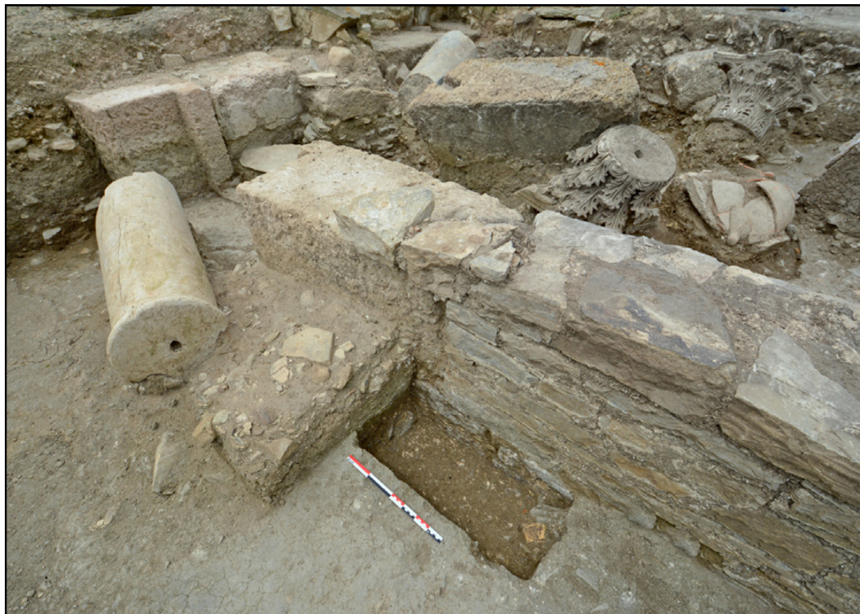
Figura 3. Restos monumentales procedentes de la necrópolis oriental de Baelo Claudia (Prados, Jiménez y Abad 2020: 169, fig.5).

algún evento destacado 21 , o dentro del Plan Estratégico de Turismo para los años 2016-2020 22 , prorrogado por temas vinculados a la pandemia por Coronavirus, donde se puede comprobar que entre una de las aspiraciones del Ayuntamiento se encuentra la incorporación del yacimiento de Baelo a sus estrategias turísticas en busca de sinergias entre ambas instituciones que favorezcan la proyección social y el turismo de la ciudad romana y el municipio.