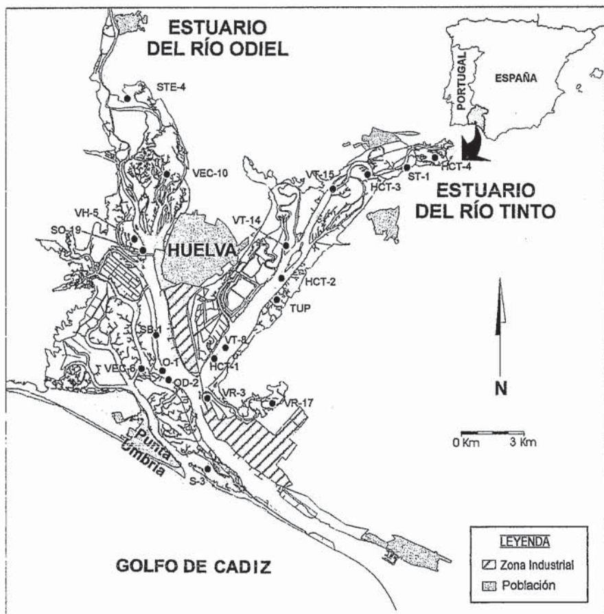
Fig. 1.- Localización del área de estudio y de los testigos analizados.