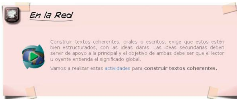
■ Imagen 5. Enlaces a páginas externas

6). Tareas. Es el apartado más importante de los contenidos. El aprendizaje está basado en la realización de esas actividades, donde el alumnado debe aplicar los conocimientos y desarrollar sus competencias básicas, especialmente las digitales. Por ello, a veces el alumnado debe crear presentaciones o vídeos que sube a Internet y enlaza al blog del aula. (Imagen 7)