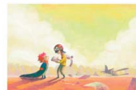
Iná Pawa. Imagen de Teresa Mtz en Flickr. Licencia Creative Commons (by-sa)

- ¿Recordáis este diálogo? ▶ ¿Este es el avión que va a Tuatu, USA? Voy a Miami. ▶ ¿Y cuando usted va a Miami pregunta por Tuatu? Tuatu es una imbecilidad aérea. - Anda, claro. Es el de aquellos dos que no se entienden porque cada uno habla de lo que le parece. - Exacto. Hablamos entonces de la coherencia textual , es decir, de la importancia de organizar bien la información, usando las palabras apropiadas y explicándonos con sencillez. ¿Lo recordáis,