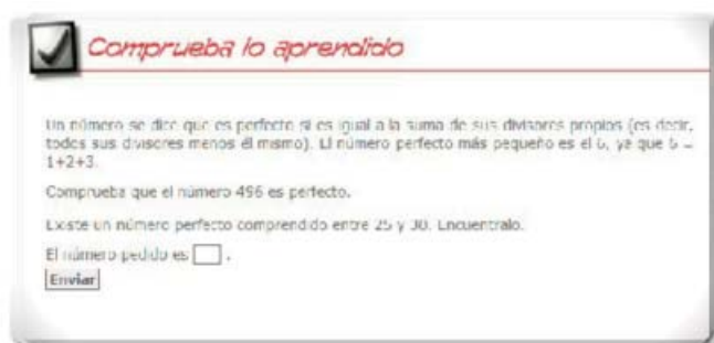
■ Imagen 4. Comprueba lo aprendido

recurrir a todos los recursos que se ponen a su alcance para conseguir elaborar el producto final que se le solicita.