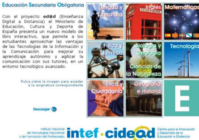
■ Imagen 1. Portada de acceso al proyecto EDAD

ado los materiales que queremos divulgar en estas líneas.