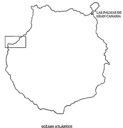
Fig.-1. Mapa de la Isla de Gran Canaria y zona de estudio.

Aparte de su forma semicircular, el rasgo geomorfológico más destacado de