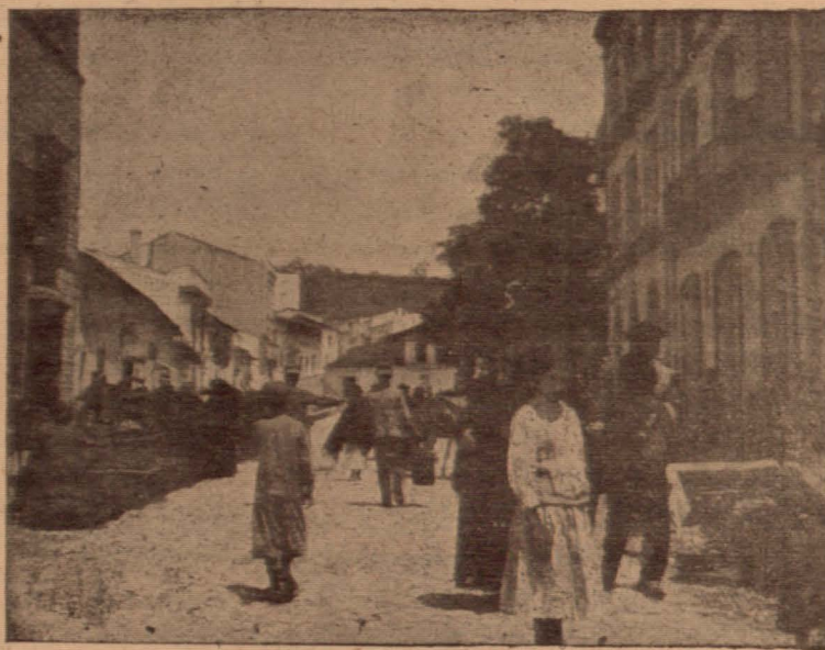
El mercado del sábado

deber, el jefe le conservará a su lado perpetuamente y aprovechará las oportunidades que se le ofrezcan para ascenderle y premiar su buen comportamiento.