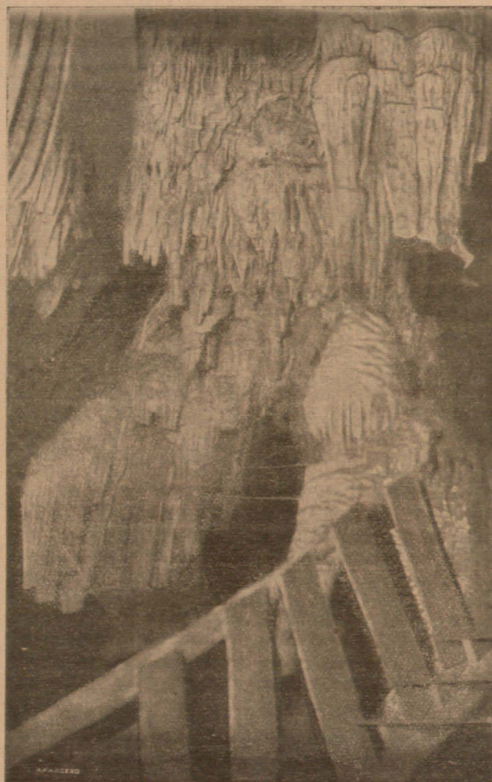
“Las colgadas de nieve“ en la Gruta de las Maravillas

don Miguel Angel del Pino y Sardá, el primer retratista al óleo de los pintores contemporáneos; don Alfonso Grosso, delicado colorista y dibujante correctísimo; don Rodolfo Franco, ilustre pintor argentino que estudia en España pensio-