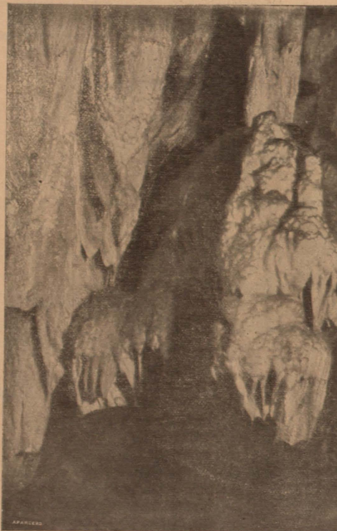
“Las garras del león” en la Gruta de las Maravillas

plos de lo que expuesto queda, y por si no fuesen suficientes en los novísimos tiempos, estalla la conflagración casi universal con los más sangrientos caracteres que presumírsele pudiera, puesto que se ventila colosal duelo a muerte entre los