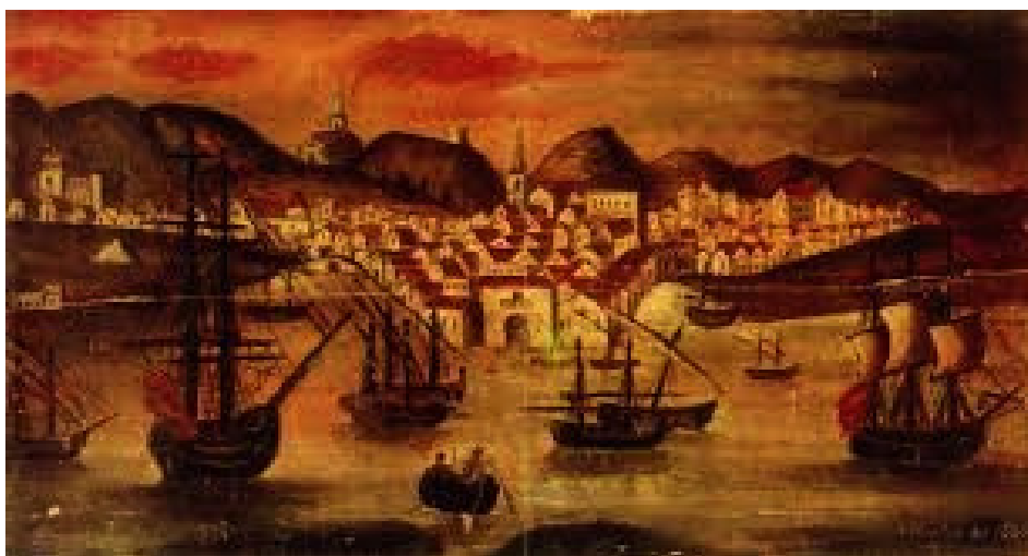
Imagen 2. Óleo sobre tabla que recrea la Huelva del siglo XVIII. A la izquierda de la imagen se observa un montículo de sal situado entre el convento de la Merced y el molino mareal de La Vega.

«...averla hecho Cabeza de partido en las especies de Aduana, Tabacos, Sal, Jabón, Pólvara, Naypes, y Tercias Reales: de los quales Ramos ay en Huelva Administraciones, y Thesorerías. Acuden a Huelva à proveerse de estas especies la Ciudad de Moguer, Almonte, Gibrleón, San Juan del Puerto, Trigueros, Beas, Niebla, Villaraza, la Palma, Bollullos del Condado, Rosiana, Bonares, Lucena del Puerto, Palos de la Frontera, Aljaraque, Ayamonte, Lepe, Cartaya, la Puebla de Guzmán, los Castillejos, Alosno, Villablanca, Redondela, Sanlúcar de Guadiana, San Silvestre, el Granado, el Almendro, San Bartholomè, Paymogo, Santa Bárbara, Cabezas Rubias, y las Cruces. Estos 32 pueblos del Partido de Huelva deben acudir à ella à surtirse de estas especies» (Mora, 1762: 143).