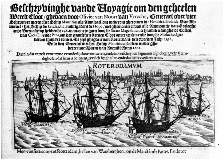
Imagen 4. Grabado con urcas, embarcaciones de carga que transportaban la sal desde San Juan del Puerto a otros puertos europeos en el siglo XVI. Portada de libro (Noort, 1602)

Con todo, los puertos del río Tinto no fueron los únicos suministradores de sal a las embarcaciones con destino a los Países Bajos, pues durante el siglo XVII se advierte la presencia de un importante tráfico comercial de este producto ejercido por los holandeses en diferentes puertos andaluces con el fin de abastecerse de la materia prima necesaria para procesar y conservar el pescado, así como para la industria de quesos, cecina y mantequilla 54 . Además, el proceso de refinado que efectuaban les generaba sustanciosos beneficios, pues compraban la sal bruta a bajo precio en los territorios hispánicos y la vendían en otros países europeos multiplicando su valor varias veces (Varela, 1980: 53; Dávila, 2015: 48).