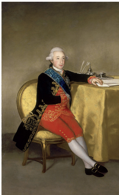
Imagen 3. Vicente Joaquín Osorio de Moscoso y Guzmán en 1787. Titular de las salinas de Huelva y de San Juan del Puerto, conde de Saltés, marqués de Astorga, y conde de Altamira, entre otros títulos nobiliarios. Fue uno de los primeros directores del Banco de San Carlos. Retrato realizado por Francisco de Goya (Colección del Banco de España)

como cabeza de partido de la administración de la renta de salinas 41 , que integraba a localidades que habían formado parte de los señoríos de Moguer, Gibraleón, Huelva, Niebla y Ayamonte (Mora, 1762: 143).