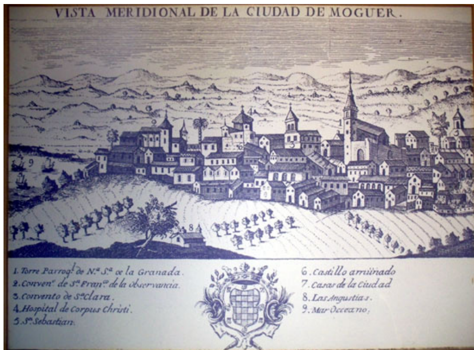
Imagen 1. Vista de la ciudad de Moguer en el siglo XVIII. En la parte izquierda de la imagen se aprecia el puerto con embarcaciones y las marismas donde estaban las salinas (Espinalt, 1795: 184)

Por otro lado, en San Juan del Puerto la actividad salinera queda atestiguada documentalmente de forma inmediata a la fundación de la localidad y, en este sentido, se ha podido constatar en los fondos archivísticos, que la explotación de la sal en su término municipal es coetánea a la época de los descubrimientos de las tierras americanas. El propio padrón de cuantías de 1503 reseña a dos individuos avocados en la villa que ejercían el oficio de salinero 8 . Unos años más tarde, a partir de 1509-1510, se aprecian en los libros de cuentas del condado de Niebla existentes en el archivo de la Fundación Casa Medina Sidonia 9 y en el fondo Osuna del Archivo Histórico Nacional las rentas generadas por las salinas 10 . Posteriormente, en la década de los sesenta del siglo XVI, en un expediente existente en el Archivo General de Indias, se