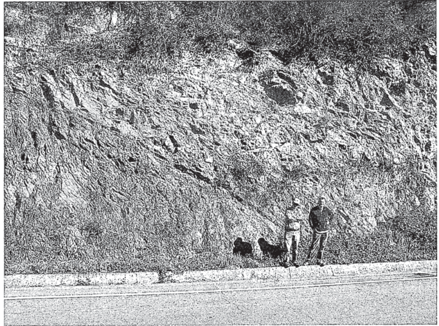
Fig. 2.- Fotografía de la discordancia Neoproterozoico-Cámbrico en el afloramiento de Villar de Lantero.

Los resultados de composición de las rocas estudiadas, que se muestran en la Figura 3, y por lo que se refiere a los elementos mayores, reflejan un progresivo enriquecimiento en sílice acompañado por una disminución del contenido de Mg, Ca y Na, compatibles con la meteorización de los feldespatos y de la clorita, por otro lado, el progresivo aumento de K indicaría una recristalización de micas que no