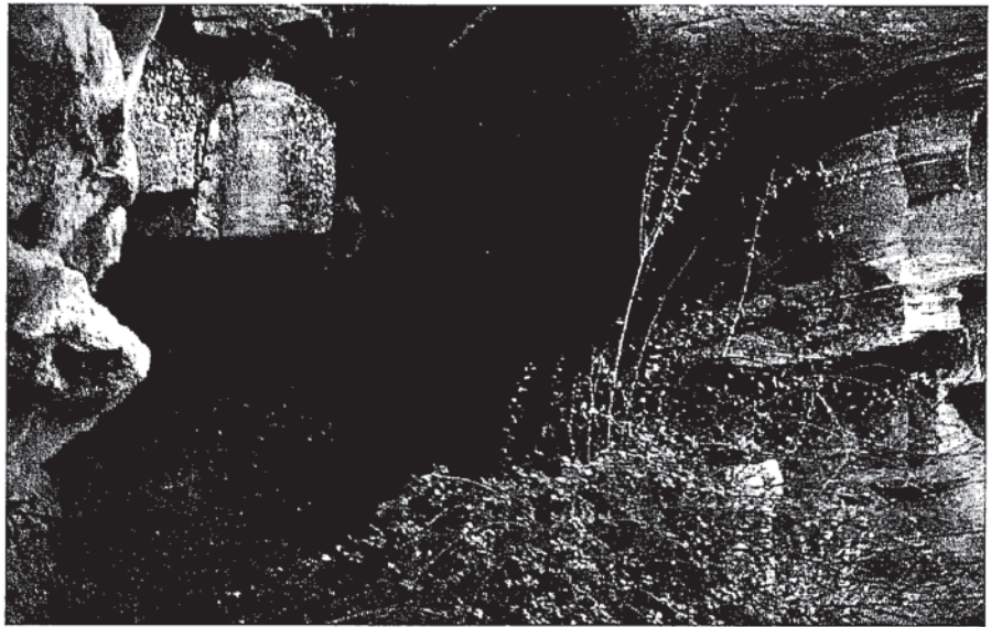
Fig. 3- Entrada a la cueva del Monasterio de la Hoz (Guadalajara), donde se introdujeron el amanuense de Torrubbía y otras personas en 1753.

También narra este autor el descubrimiento que un cabrero hizo de una cueva " en las empinadisimas Montañas de Nuestra Señora de la Hoz " (Guadalajara) a finales de marzo de 1753 (Torrubbía, 1754, 76-78). Dentro de ella había restos de grano y enormes huesos. Al conocer la existencia de aquellos