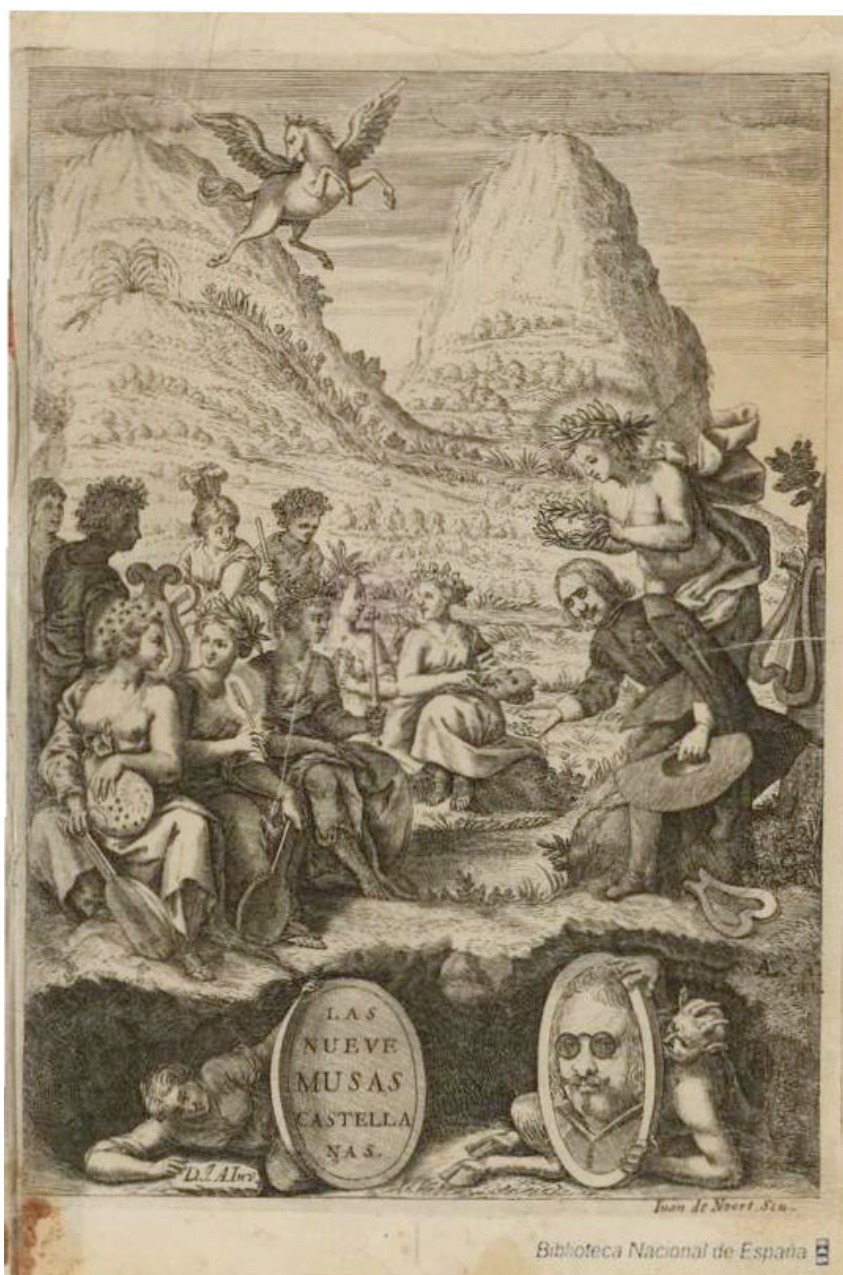
Figura 14 Quevedo, El Parnaso español , 1648