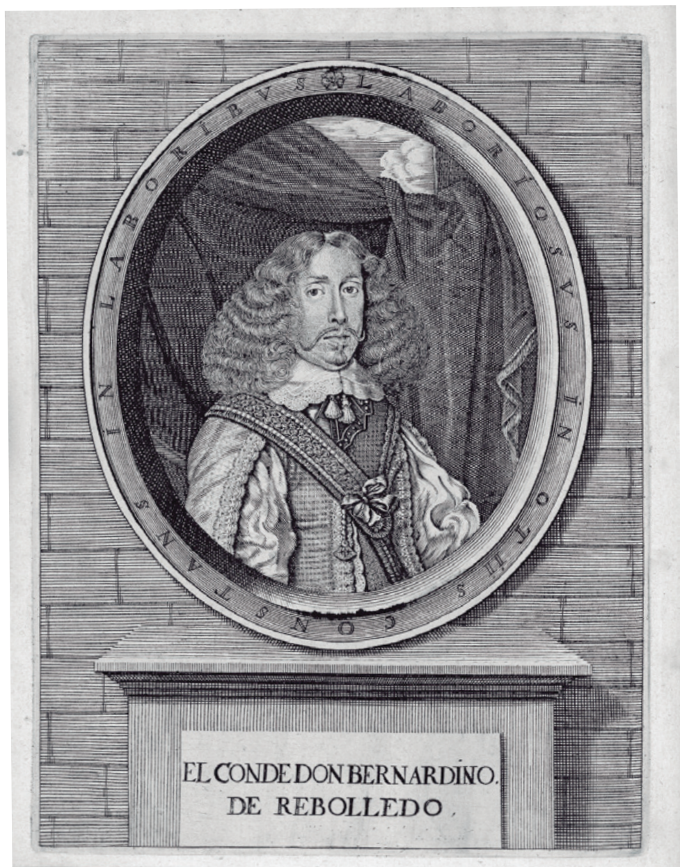
Figura 11 Conde de Rebolledo, Ocios , 1660