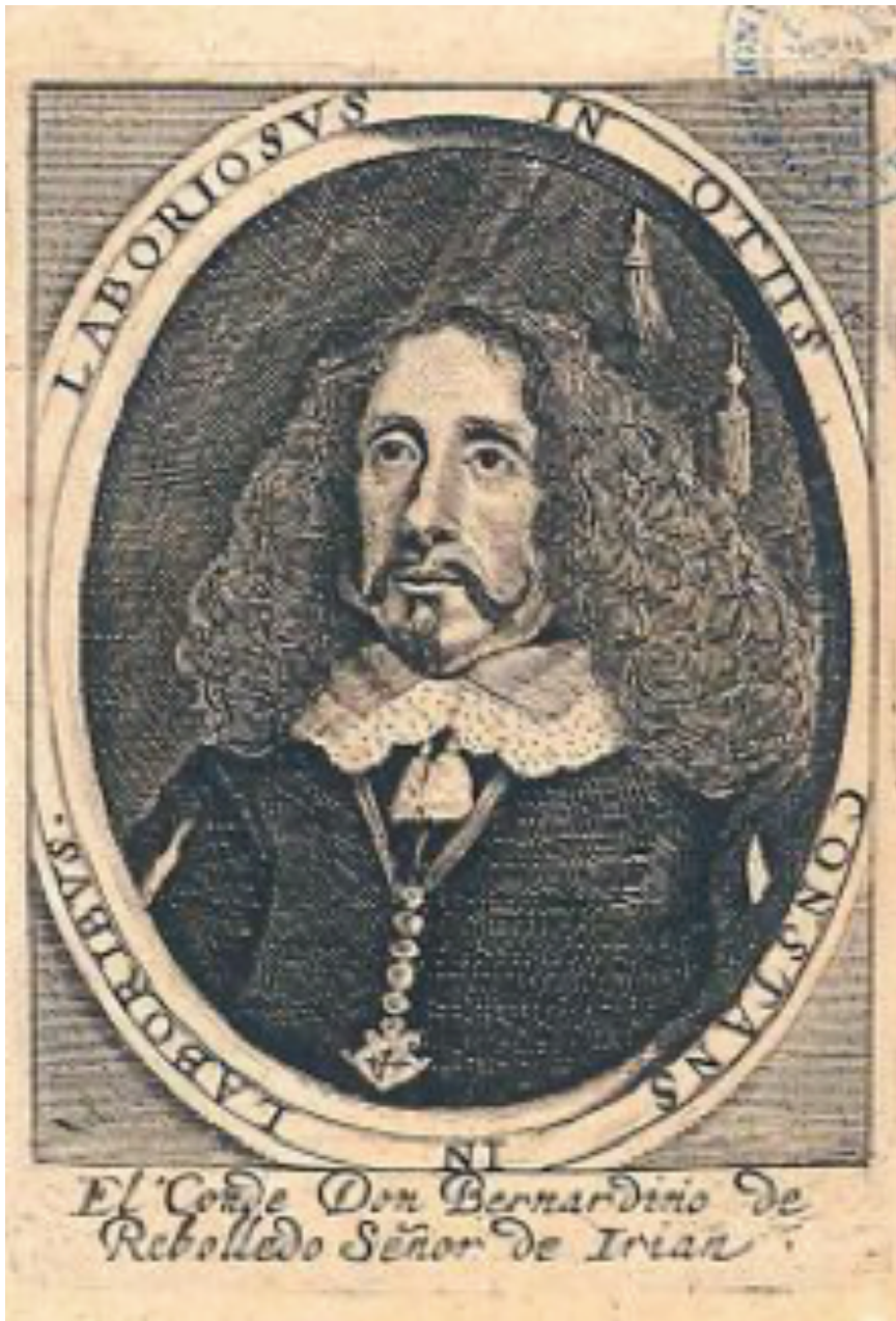
Figura 10 Conde de Rebolledo, Ocios , 1650