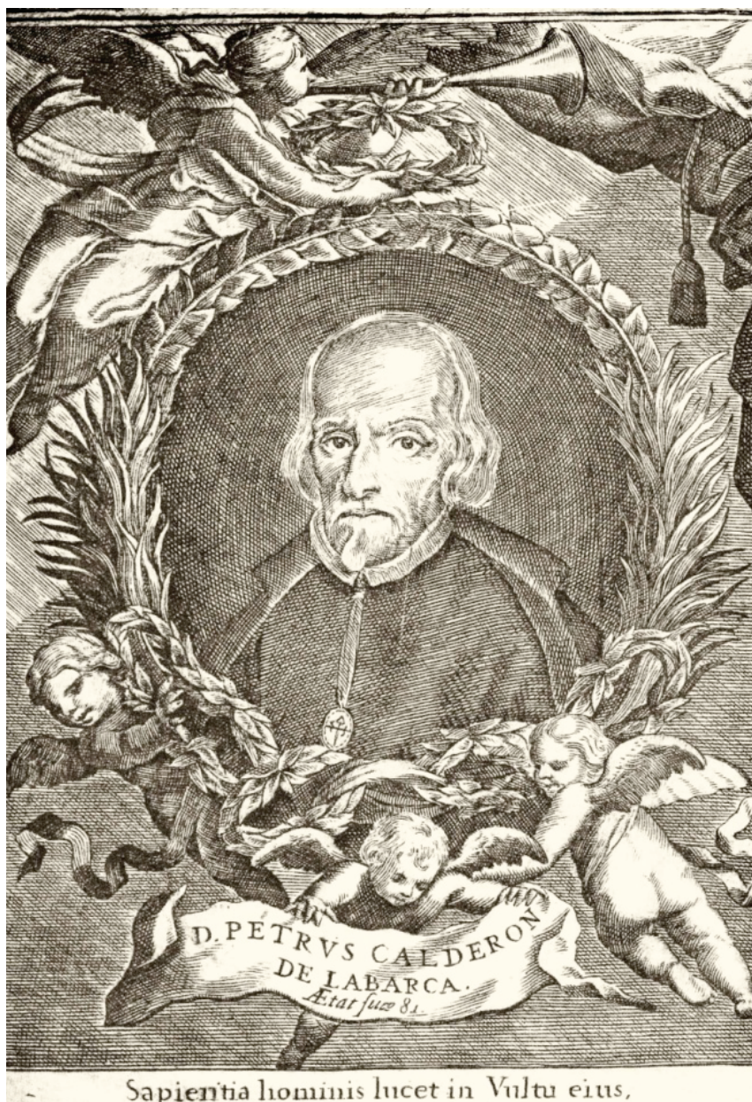
Figura 12 211

Grabado de Pedro Calderón de la Barca, por Fosman y Medina (1582)