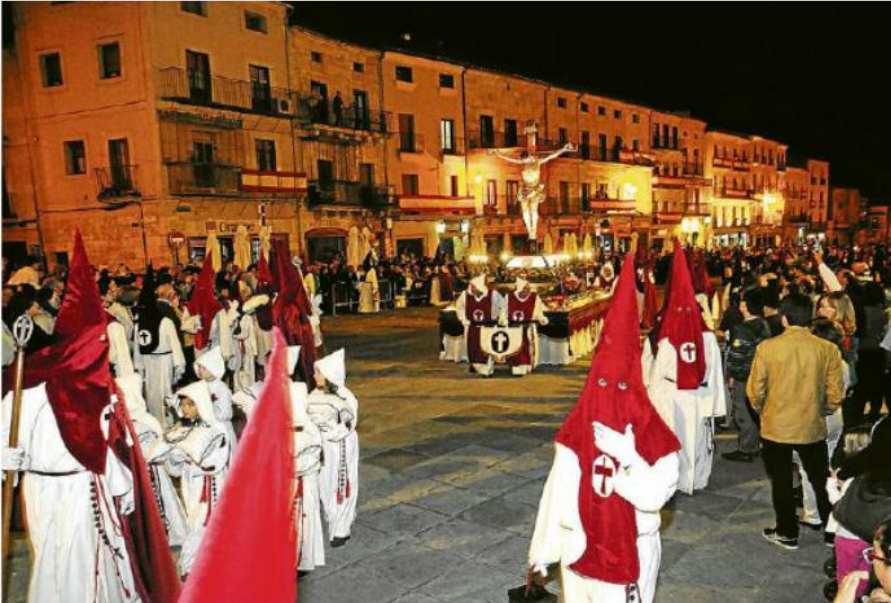
Figura 4. Cofradía del Santísimo Cristo de la Expiración. Ciudad Rodrigo

La meta de este estudio es fortalecer las tradiciones y costumbres populares existentes en los municipios, impulsar la participación social de diferentes colectivos, implicar con especial atención en las actividades culturales a los jóvenes del municipio, favorecer el ocio y tiempo libre de todos los sectores de la población rural, conseguir un desarrollo local a través de distintas actividades culturales, y potenciar el reclamo turístico para el municipio, a través de la divulgación de sus fiestas tradicionales. Por eso creo imprescindible conocer las debilidades, amenazas, fortalezas y oportunidades (análisis DAFO) de la zona en relación con la actividad turística.