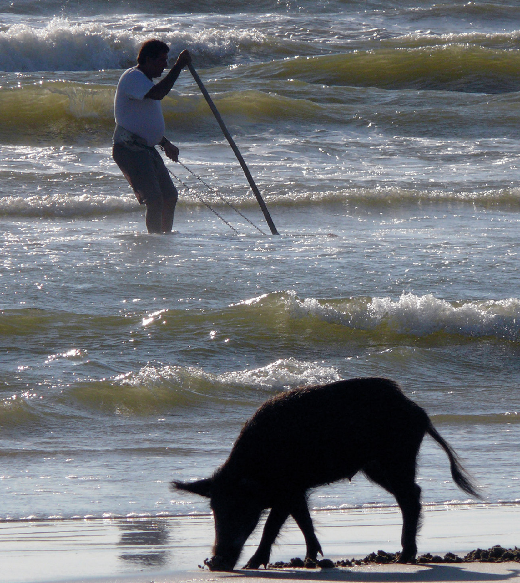
FIGURA 10-10 | Una escena curiosa que solo se puede ver en Huelva, un jabalí ( Sus scrofa ) y un coquintero, ambos pescando coquinas e ignorándose mutuamente