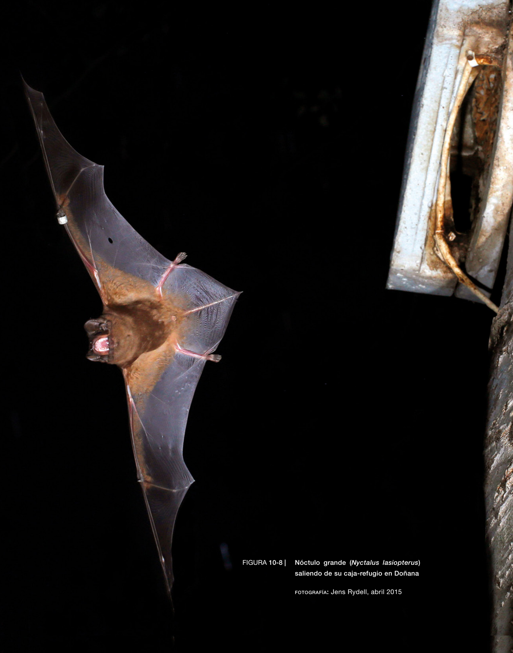
FIGURA 10-8 | N6ctulo grande ( Nyctalus lasiopterus ) saliendo de su caja-refugio en Doñana