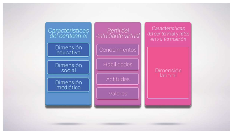
Figura 2. Relación entre las características del centennial y el perfil del estudiante virtual.

Para el registro de la información se utilizó como instrumento una matriz por dimensión, en las cuales se sintetizó la información utilizando como categorías de análisis las propias dimensiones y subdimensiones establecidas; así como una matriz para registrar las ideas más frecuentes en los documentos revisados en relación con el perfil del estudiante virtual. En la Figura 2 Se representa las dimensiones educativa, social y mediática como características de ingreso a la educación virtual y la dimensión laboral como características de ingreso o retos en su formación.