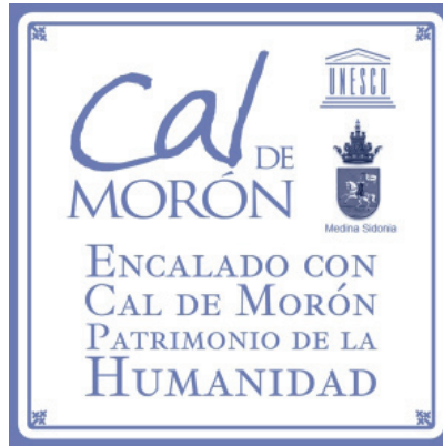
Ilustración 3: Azulejo promocional de la cal de Morón para el Ayuntamiento de Medina Sidonia