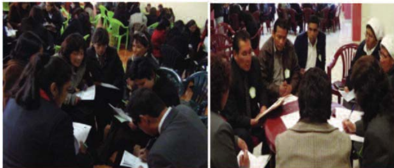
Figura 2. Docentes de aula taller de consulta y diálogo en la zona Alto Andina.

En total se desarrollaron doce reuniones talleres con las maestras y maestros de aula de educación inicial, primaria y secundaria. También participaron especialistas de las UGEL. Estos talleres fueron dirigidos por docentes del equipo central y organizados por el equipo local de maestros. Las propuestas se consolidaron en matrices por cada zona y UGEL.