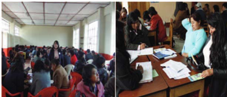
Figura 1. Docentes de aula taller de consulta y diálogo en el Valle del Mantaro.

Se aplicó la metodología de construcción social participativa del currículo, desde abajo hacia arriba, desde los actores educativos y sociales, quienes establecieron sus demandas y necesidades educativas en la fase de diagnóstico y validación.