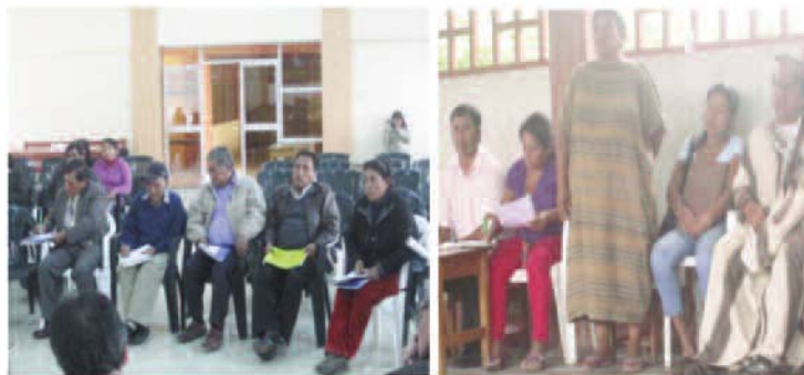
Figura 3. Docentes de aula taller de consulta y diálogo en la Selva Central.

También se organizaron mesas de diálogo y consulta con padres de familia, autoridades comunales y representantes de organizaciones del sector económico, social y cultural en cada provincia sede de las UGEL. Con ellos se analizaron las siguientes interrogantes: ¿Cuáles son los problemas o debilidades que tiene actualmente la educación en tu comunidad, provincia o distrito?, ¿Qué sugerencias podrían plantear para mejorar la educación en tu comunidad o provincia? ¿Qué aportes específicos podría proponer tu organización para mejorar la enseñanza en los niveles inicial, primaria, secundaria y modalidades?