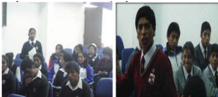
Figura 4. Estudiantes en taller de consulta y diálogo en el Valle del Mantaro.

También se aplicaron entrevistas y encuestas: 3285 estudiantes, 367 docentes, 653 padres de familia, 218 directores de instituciones educativas focalizadas en capital distrital y centros poblados del ámbito referido. En este proceso se recogieron necesidades, problemas, demandas educativas y propuestas para la construcción del Currículo Regional. Por otro lado, se analizó y sistematizó información de diagnóstico y prospectiva en diversos proyectos y planes regionales y nacionales, Propuestas e iniciativas curriculares en el ámbito regional y otros aportes. Asimismo, se analizó el Marco Curricular Nacional (1ra y 2da versión), propuesto por el Ministerio de Educación (2013). También se desarrollaron tres estudios de investigación a nivel regional: Diagnóstico del estudiante, diagnóstico etnolingüístico y diagnóstico del docente, cuyos resultados sirvieron para la fase de diagnóstico y formulación curricular, y será provechoso también para la etapa de implementación, ejecución y evaluación.