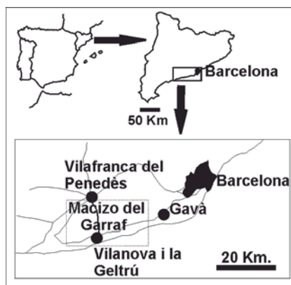
Fig. 1.- Situación geográfica del macizo de Garraf en el NE de la Península Ibérica.