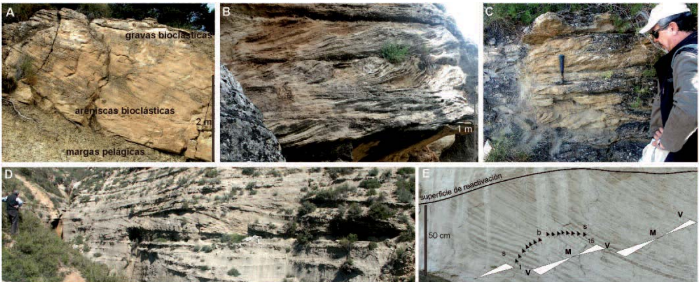
Fig. 2.- A. Secuencia granocreciente de gravas y areniscas bioclásticas sobre margas pelágicas, B. Coset formado por el apilamiento vertical de sets de estratificaciones cruzadas unidireccionales. Los estratos cruzados del tercer set aparecen deformados, C. Apilamiento de sets de poca altura de estratificaciones cruzadas de arenas de grano muy grueso y gravas, D. Set de estratificación cruzada en surco (debajo del set y hacia la izquierda en la foto se observa otro set de estratos cruzados buzando en sentido contrario), E. Alternancia de láminas claras de composición bioclástica (b) y oscuras de composición siliciclástica (s) conformando la organización interna de una duna interpretada en términos de ciclos mareales de alta frecuencia (M-marea muerta; V-marea viva).