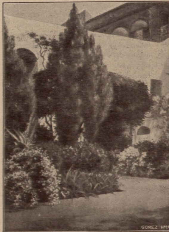
Alcázar de Sevilla.—Patio de la Sultana