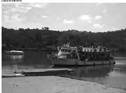
Embarcaderos estacionales (orilla portuguesa).