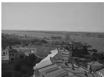
Ayamonte desde el Parador.

terpretación jalonan este territorio. A ese patrimonio cultural se unen espacios protegidos de marismas (zapales) y bosques mediterráneos (Parque Natural Vale do Guadiana en el municipio de Mértola, Andévalo Occidental, Paraje Natural Peñas de Aroche y Parque Natural Sierra de Aracena y Picos de Aroche).