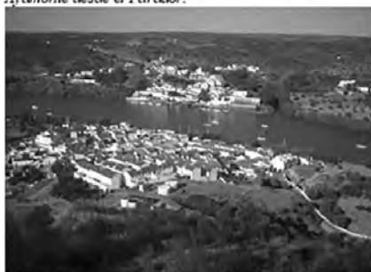
El río Guadiana, a su paso por Sanlúcar de Guadiana y Alcoutim.