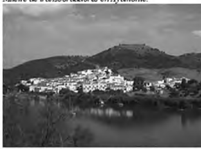
Sanlúcar de Guadiana desde la orilla portuguesa de Alcoutim.