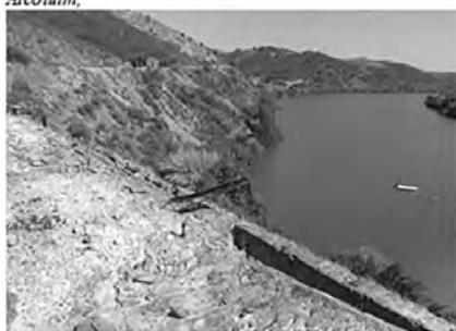
Antiguo embarcadero de mineral en Puerto de La Leja (municipio de El Graxado).