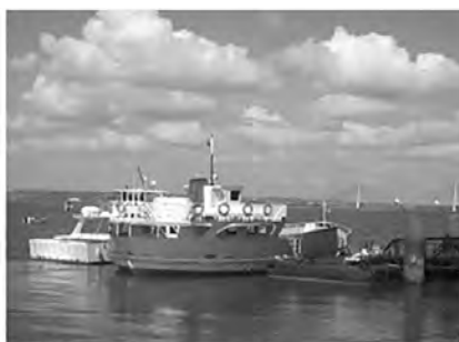
Muelle de transbordadores en Ayamonte.