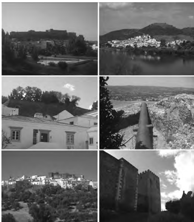
Figura 3. Castillos en la Frontera del Bajo Guadiana. De izquierda a derecha y de arriba abajo: Castro Marim. Sanlúcar de Guadiana. Alcoutim. Encinasola. Aroche. Mértola. Fotos de J. M. Jurado, 2010.