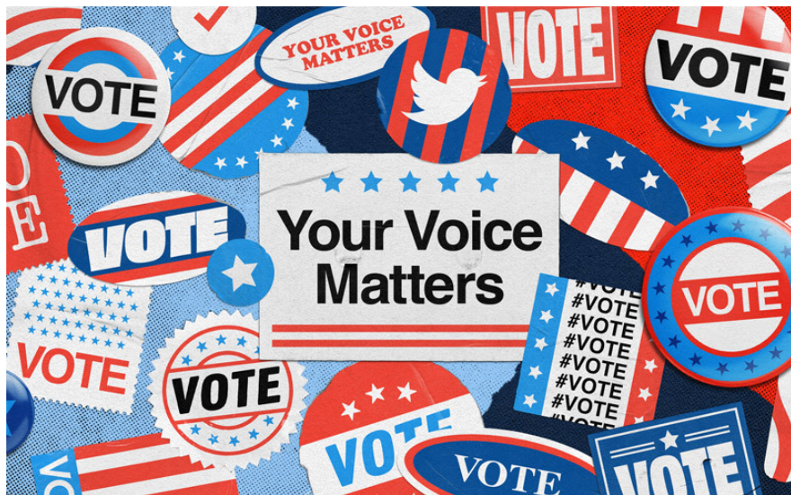
Imagen 1: Las campañas electorales a través de las redes sociales (2020)

Bargh, 2000), promoviendo el intercambio deliberativo de ideas y pensamientos (Papacharissi, 2002). Y por último la conexión con vínculos débiles (también denominados lazos débiles) en la conformación de una red social heterogénea expone al sujeto más fácilmente a nuevas ideas produciendo mayor diversidad de pensamiento que una red conformada solo por vínculos o lazos fuertes (Granovetter, 1973).