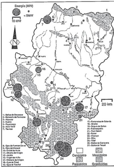
Figura 2.-Principales manantiales termales en Aragón y su flujo geotérmico en MW.