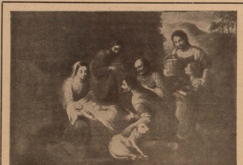
El Nacimiento del Mesías

Famoso cuadro de Murillo, existente en el Vaticano