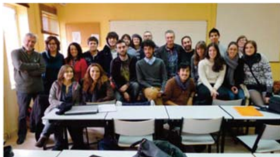
IMAGEN 17: Profesores y alumnos participantes en el primer encuentro para la puesta en marcha de los contenidos y la Web del proyecto Jóvenes frente al cambio climático. Enero de 2012, Madrid.

Por lo tanto podemos concluir que «Jóvenes frente al cambio climático» ha constituido una nueva experiencia de progreso en la innovación educativa de «Los jóvenes vistos por los jóvenes», orientando la producción hacia las nuevas plataformas de contenidos y consumo audiovisual preferidas por los jóvenes: Internet, redes sociales, móviles y tablets. Esta nueva coproducción audiovisual y educativa ha desarrollado contenidos audiovisuales transmedia empleando nuevos formatos y estructuras narrativas adaptadas a las diferentes ventanas.