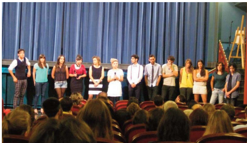
IMAGEN 1: Presentación del documental en la sala principal del Cine Doré (FilMOTECA Española) el 6 de octubre de 2012. Tras la proyección de la obra y la presentación de la Web transmedia del proyecto, los jóvenes autores de centro Puerta Bonita de Madrid responden al público.

En el último proyecto audiovisual de innovación desarrollado durante el curso 2011-2012 y titulado «Jóvenes frente al cambio climático» se ha llevado a cabo la coproducción de una obra documental de 45 minutos del mismo título, además de una web audiovisual documental que contiene 33 piezas audiovisuales que desarrollan el potencial interactivo del documental y suponen una experiencia de elaboración de contenidos transmedia para una nueva plataforma de distribución diseñada por los propios autores.