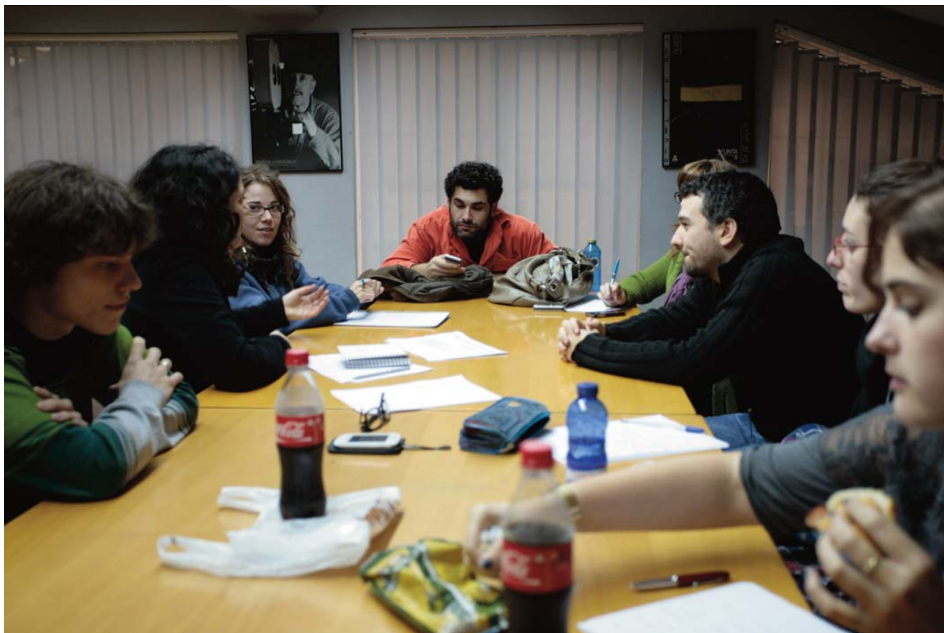
IMAGEN 5: Equipo de trabajo del centro Imaxe e Son de A Coruña durante el desarrollo de los guiones de las piezas para el documental y la web de del I+D «Jóvenes frente al cambio climático». Diciembre de 2011.

a. Hacer un retrato de la realidad vivida por un grupo de jóvenes involucrados en el tema tratado en el que se muestran a los citados jóvenes en acción.