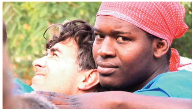
IMAGEN 9: Joven protagonista de la pieza titulada «Rambla de culturas» elaborada por los jóvenes del Institut Pere Martell para el documental «Cuatro visiones, jóvenes e inmigración en España».

la realización de las grabaciones. A la vez, se hacía necesario coordinar numerosos aspectos técnicos que hicieran compatible los procesos finales de montaje y postproducción de imagen y sonido llevados a cabo en cada centro participante.