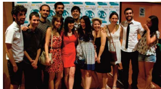
IMAGEN 20: Alumnos/as del centro formativo Puerta Bona (Madrid) en el auditorio de Tomares (Sevilla), antes del estreno del documental «Jóvenes frente al cambio climático». Tomares, Junio de 2012. El estreno fue recogido en varios medios por la prensa regional.

El equipo de profesores e investigadores que se ha consolidado gracias a esta red para el desarrollo de proyectos de coproducción audiovisual entre jóvenes de diferentes centros educativos que imparten formación profesional de grado superior; continuará trabajando con la misma filosofía que inspiró la puesta en marcha de este proyecto hace doce años, lograr que jóvenes autores y creadores elaboren su propio discurso dirigido al público en general pero especial-