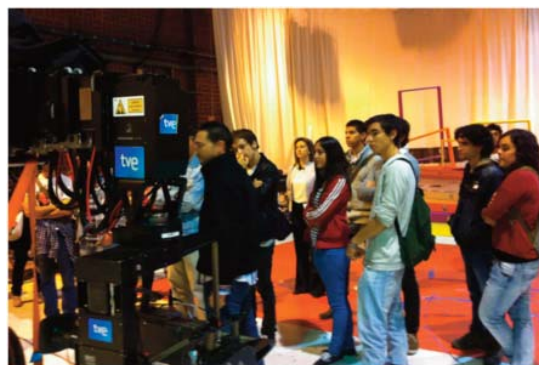
IMAGEN 14: Alumnos de los diferentes centros educativos durante la visita técnica guiada por profesionales de TVE el mismo día de la grabación del programa especial de «La Aventura del Saber». Octubre de 2011.