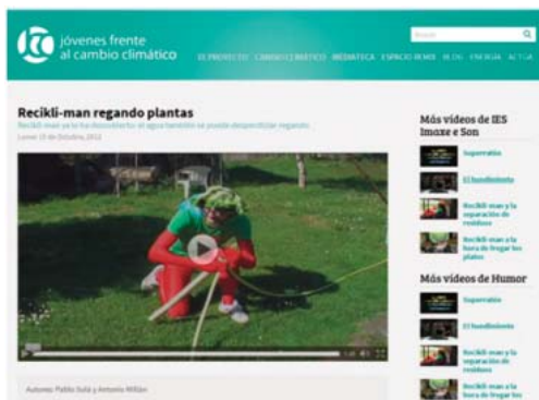
IMAGEN 6: Imagen de la Web Jóvenes frente al cambio climático. Recikli-man es el nombre de este personaje ideado por los alumnos para la web que vela por el cuidado del medio ambiente empleando «métodos» un tanto singulares.