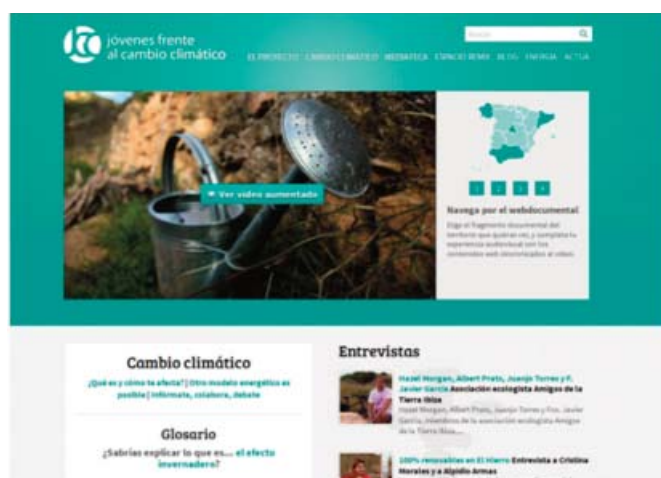
IMAGEN 10: Imagen de la página principal de la Web del proyecto I+D «Jóvenes frente al CC». El vídeo central ofrece la opción al internauta de ver la versión «expandida» o interactiva del documental. La web dispone de gran variedad de piezas audiovisuales relativas al contenido de las diferentes páginas. Estas piezas se encuentran clasificadas en la Mediateca.