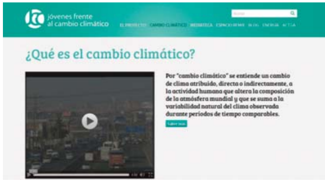
IMAGEN 11: Parte superior de la página dedicada al fenómeno del cambio climático en la Web «Jóvenes frente al cambio climático»