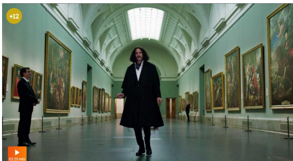
Fotograma tráiler oficial El Ministerio del Tiempo (Temporada 4, capítulo 38: La memoria del tiempo ). La dialéctica de la obra del arte .

Eso es mérito de Christian Flores. Recuerdo que cerramos la tercera temporada y a los 20 días vi en Youtube el “ Velázquez yo soy Guapa ” y me dije « si hay otra temporada meto eso en el Prado ». ¡Y se ha conseguido, no! No se sí el hecho de la fuerza de Velázquez ha ayudado también a que Christian piense en ese trap, pero es una dialéctica que sale fluida y que me vino hecha. Ahora el riesgo de mezclarlo, de poner a Velázquez a bailar un trap, es un riesgo que asumo. Como decía antes, EMDT es una serie pop de aventuras que mezcla historias con lo fantástico, es apropiación de imágenes y de personajes, descontextualización e ironía. Todos ellos son elementos del Arte Pop, del año del International Group de Londres, de Richard Hamilton, y de Liechtenstein. Esos mismos códigos son los que yo utilizo. Pero lo pop siempre ha sido bastante despreciado en España. De hecho ha habido grandes lagunas debido evidentemente a los muchos años de dictadura en la que la ironía, la imagen viva, la alegría no tenía mucha razón de ser. Incluso, en parte, cuando surge el Equipo Crónica por ejemplo se lo mira por encima del hombro, y cuando surge Almodóvar, una cultura pop evidente, es masacrado.