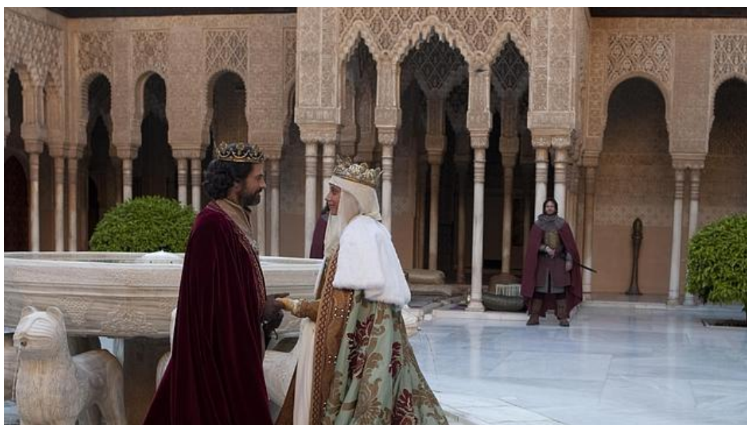
Fotograma de la serie Isabel rodada en el espacio patrimonial de la Alhambra.

Galdós. Ya en EMDT lo adaptamos a una serie de aventuras. En la primera temporada elegimos símbolos y temas históricos que dominábamos. A partir de ahí, entró la búsqueda del momento histórico que podía significar algo y definir nuestro presente en base al pasado. Así encontramos la desigualdad de la mujer, los héroes anónimos, los perdedores y los desaparecidos. A partir de todo eso hablamos del ahora yendo al pasado, pero no imaginando un pasado reescrito como nos convendría, porque la labor del Ministerio, y su lema es que el pasado no se reescribe.