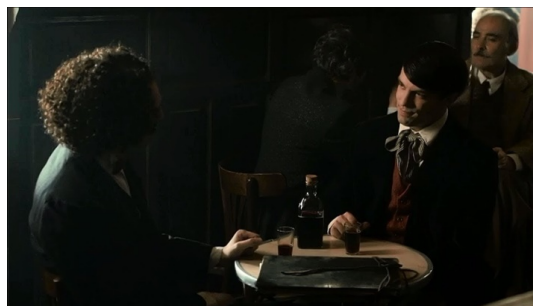
Fotogramas de la Serie El Ministerio del Tiempo. Encuentro de Diego Velázquez con Pablo Picasso (Temporada 1) y Francisco de Goya (Temporada 3).