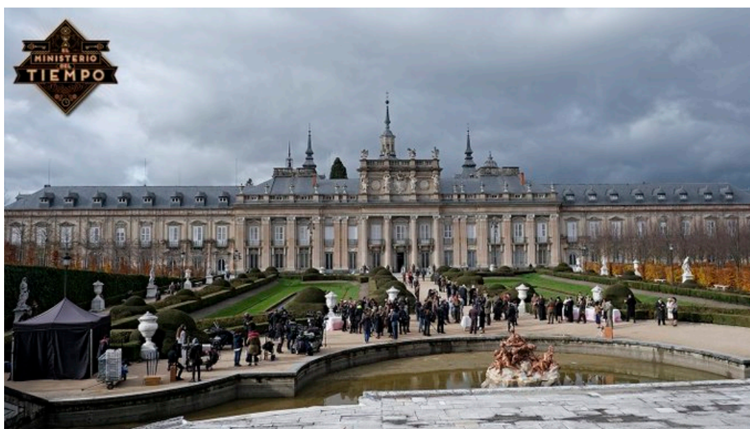
Fotografía de un día de grabación en el Palacio Real de la Granja de San Ildefonso.