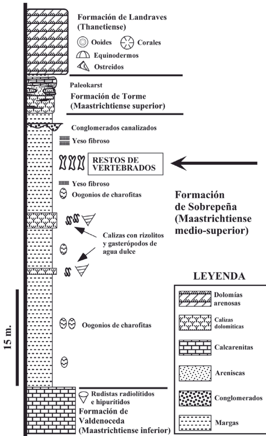
Fig.2.- Sección estratigráfica del tránsito Cretácico-Terciario en Quecedo de Valdivielso, indicando la situación de los restos de vertebrados.