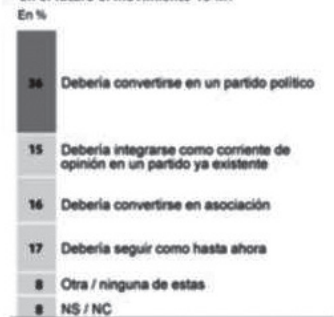
Figura 5 (superior) y Figura 6 (inferior): Fuente: Metroscopia para El País

► ¿Cómo cree que debería evolucionar en el futuro el movimiento 15-M? En %