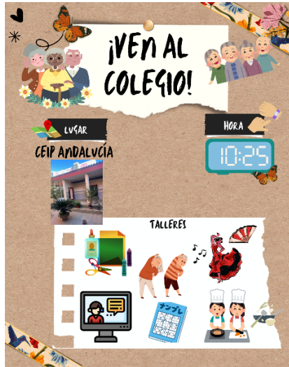
Ilustración 2. Publicidad para captación de voluntariado