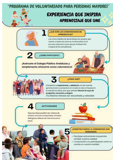
Ilustración 3. Publicidad para captación de voluntariado

Como parte de la Fase 2: Formación, se ha planteado un curso el que se pretenden realizar acciones recogidas en las propuestas de la Agencia Andaluza de Conocimiento para las titulaciones. En este caso se responde a estas acciones porque las prácticas planteadas en este curso, por parte del voluntariado, pueden servir materia de Prácticas Académicas Externas para asegurar la adquisición de los resultados de formación y de aprendizaje propuestos en asignaturas como es la de Organización de Centros Educativos y/o en