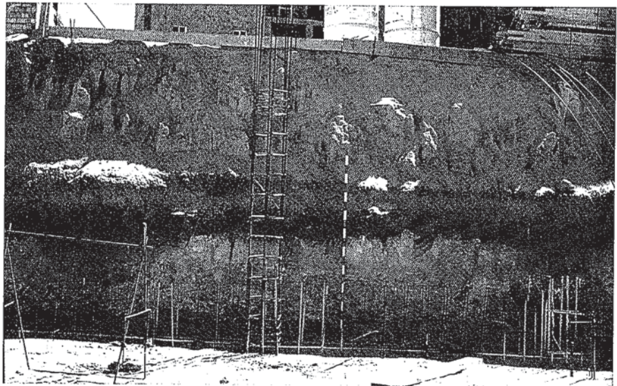
Fig. 3.- Picture shows at lower part, a red Plio-Pleistocene Palaeosoil overlain by a Recent Holocene aeolian sand deposits wich included the protohistorical archaeological studied record. (Puerto de Santa María, Cadiz, Spain)