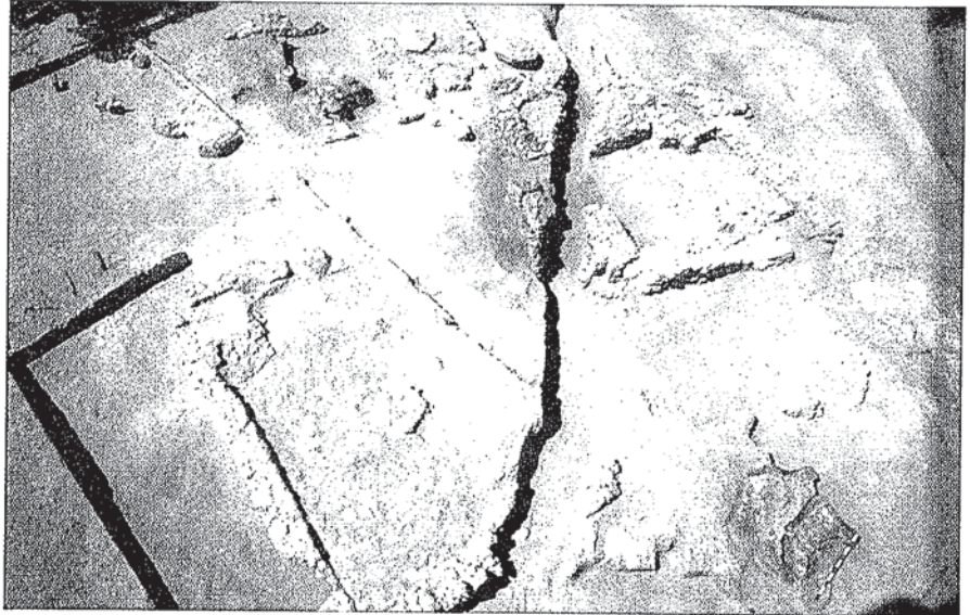
Fig. 2.- General view of P19 protohistorical archaeological site (Puerto de Santa María, Cadiz, Spain)