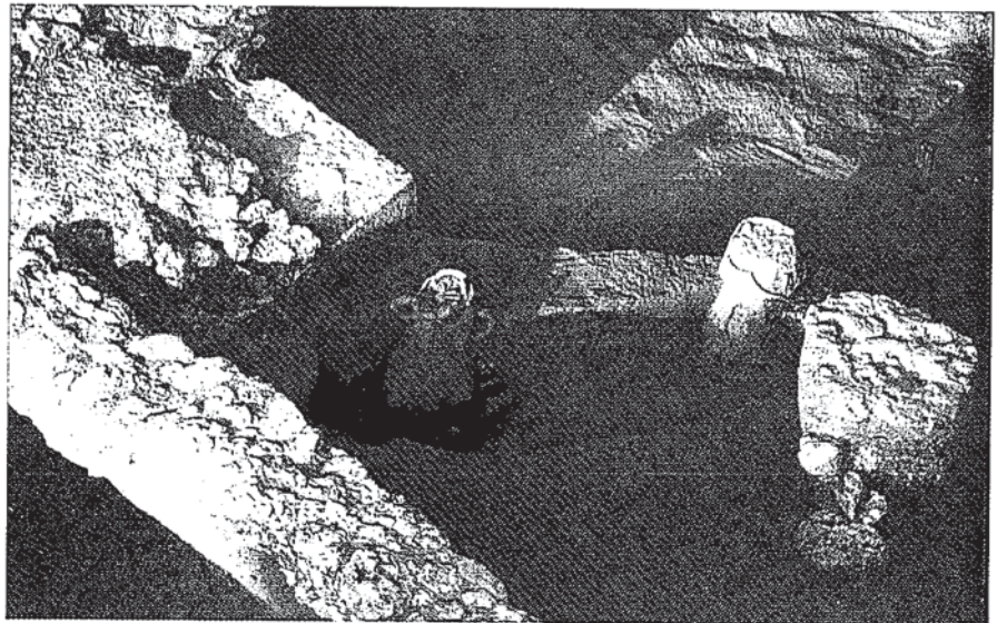
Fig. 4.- Detail of P19 protohistorical archaeological site. At the central part of the picture appears Mañá-Pascual A4 amphoras, which were found "in situ". (Puerto de Santa María, Cadiz, Spain)