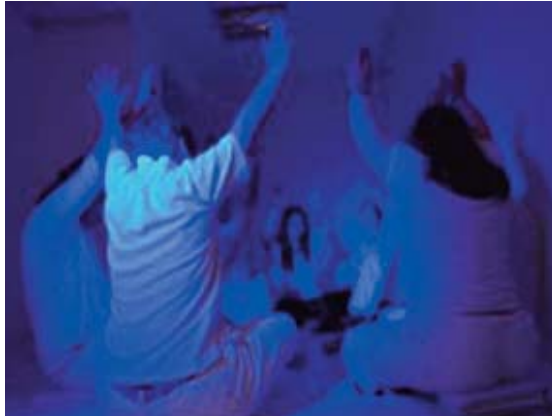
■ «The broken hips»

Desarrollamos paralelamente en el aula del instituto