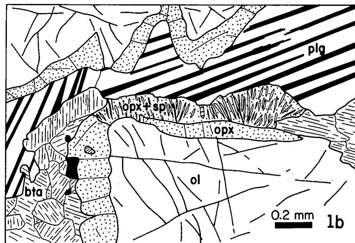
Fig. 1.—Aspectos texturales de los gabros coroníticos. 1a) Corona de ortopiroxeno en gabro anfíbolizado. 1b) Corona doble, incompleta, de ortopiroxeno y de ortopiroxeno con espinela en texturas simplectíticas.