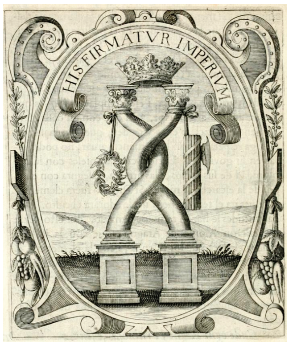
FIG. 4. Empresa « His firmatur imperium », edición de 1640.