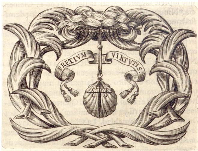
FIG. 5. Empresa « Pretium virtutis », edición de 1642.