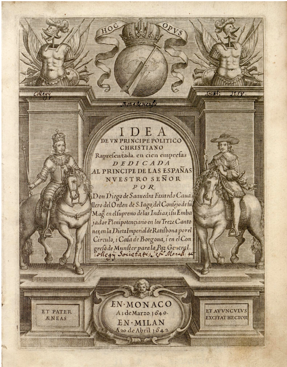
FIG. 3. Frontispicio de la segunda edición (Milán, 1642).