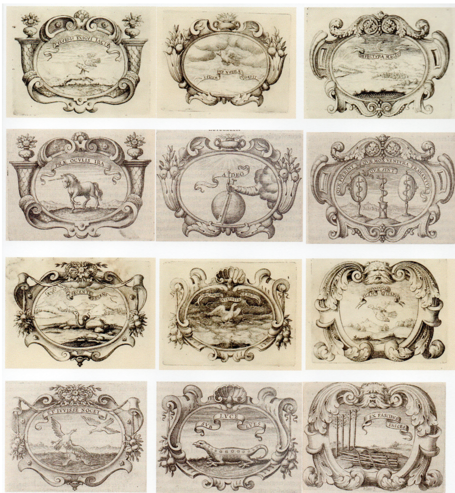
FIG. 6. En líneas 1 y 3, cartelas con picturae de la obra Le publiche dimostrazioni... En líneas 2 y 4, las empresas de Saavedra con las mismas cartelas (Milán, 1642).

Agnelli. En esta fecha ya habría muerto Giovanni Battista Malatesta, y por eso aparece solo como impresor el hermano, Giulio Cesare.