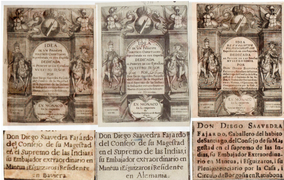
FIG. 2. Diferentes estados de la portada de la editio princeps .

Hay incongruencia en las fechas, pues aunque en portada figura: «En Monaco, En la imprenta de Nicolao Enrico, a 1 de marzo 1640», la dedicatoria al príncipe está fechada cuatro meses después, en Viena, a 10 de julio de 1640. Algunos de los cargos o méritos del autor a que se alude son posteriores también a la fecha indicada, como el nombramiento de plenipotenciario por el Círculo de Borgoña en la Dieta Imperial de Ratisbona (septiembre de 1640) y la condición de Saavedra de Caballero de la orden de Santiago, que solo aparece en algunos ejemplares y que no se produjo hasta enero de 1641. Hasta cierto punto, este tipo de desajustes de fecha se hallan a menudo en los libros impresos en el siglo XVII. Sin embargo, hay otro incidente mucho menos frecuente y más importante.