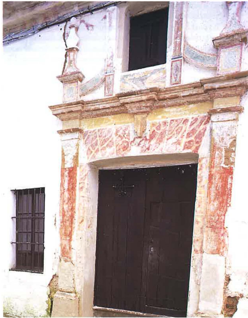
Casa aristocrática en Cañaveral.

Globalmente el partido más votado en la provincia siguió siendo UCD, con un apoyo total del 34,38% del total de los votantes. CD apenas alcanzó respaldo -el 0,36%-. El PSOE obtuvo sus peores resultados -apenas el 31%-, por el contra-