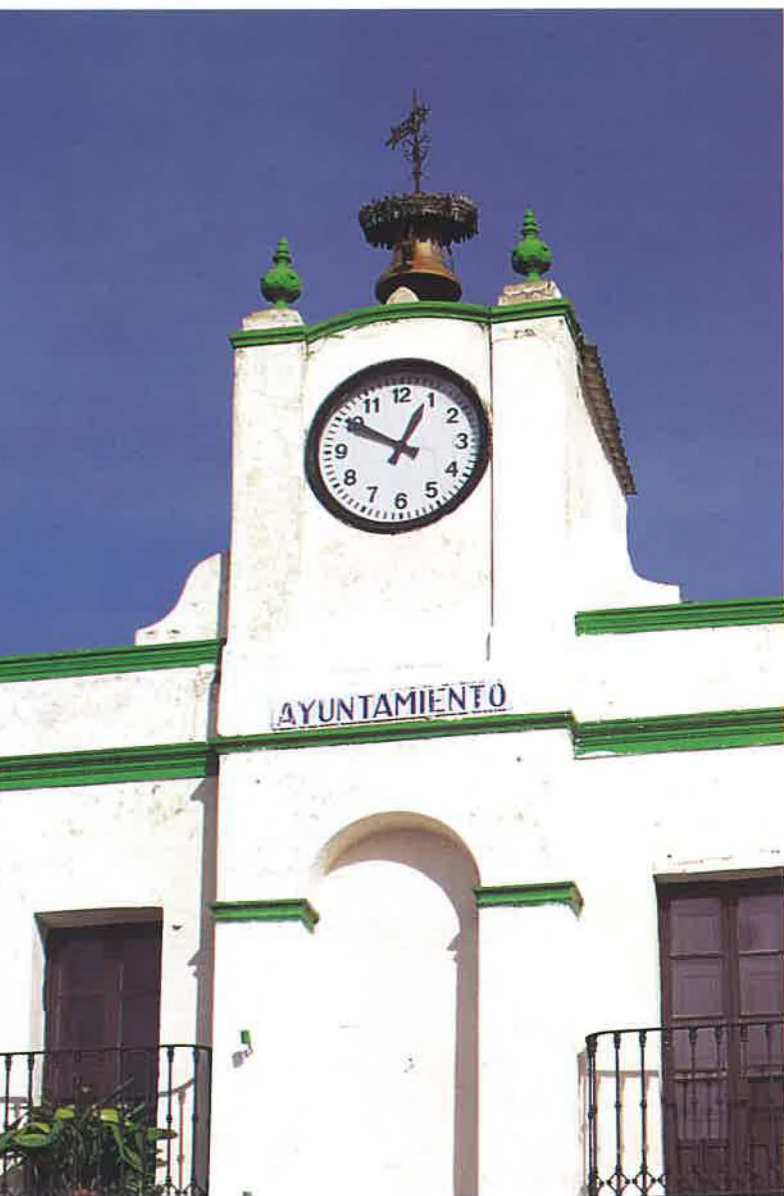
Cañaveral de León.

Durante la década de los setenta, la población de Huelva capital se incrementa en 22.305 habitantes, así en la ciudad vivía hacia 1974 casi el 25% del total de la provincia, 114.239 habitantes. Esto significa un crecimiento importante en relación con épocas anteriores, debido a las nuevas posibilidades económicas de la ciudad y explica también las novedades en el ámbito social. En tanto, como ha recordado Cristóbal García, el Informe del Banco de Bilbao sobre “La renta nacional de España y su distribución provincial” para los años 1971-1973 demuestra que el crecimiento económico en conjunto de la provincia es muy inferior a la media española, un 0,6% frente a un 2,2%, mientras que el aumento de la población ocupacional se mantiene. Además, para el conjunto de la provincia, los ingresos per cápita han crecido en proporción inferior a la media nacional, por ello la situación relativa de Huelva con respecto a otras provincias ha empeorado en este bienio, pasando del lugar 35 que ocupaba en 1971 al lugar 39, en 1973.