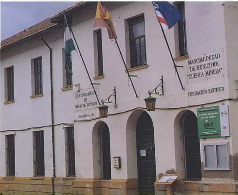
Mancomunidad de Riotinto.