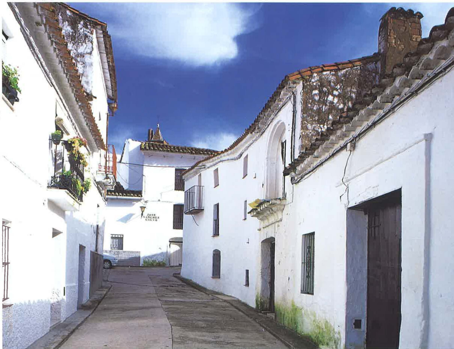
Calle típica de Cañaveral.

Esta economía primaria básicamente de subsistencia impedía obtener aceptables niveles de renta a todos sus pobladores. Es así como desde finales de los años cincuenta de este siglo que despedimos se generalizó, como en otros tantos pueblos de la Sierra, el fenómeno de la emigración . Fueron muchos los cañeteros que partieron para buscar un mejor sustento y calidad de vida, hacia la capital onubense, Sevilla, Madrid e, incluso, incluso hacia países europeos. De esta manera, de los 1.032 habitantes con que contaba Cañaveral en el censo de 1950 se pasa a 621 en 1981. Desde entonces el flujo emigratorio se ralentiza pero, como consecuencia del envejecimiento demográfico, su población sigue bajando, pasando a tener 514 habitantes en 1998; prácticamente la mitad que medio siglo antes.