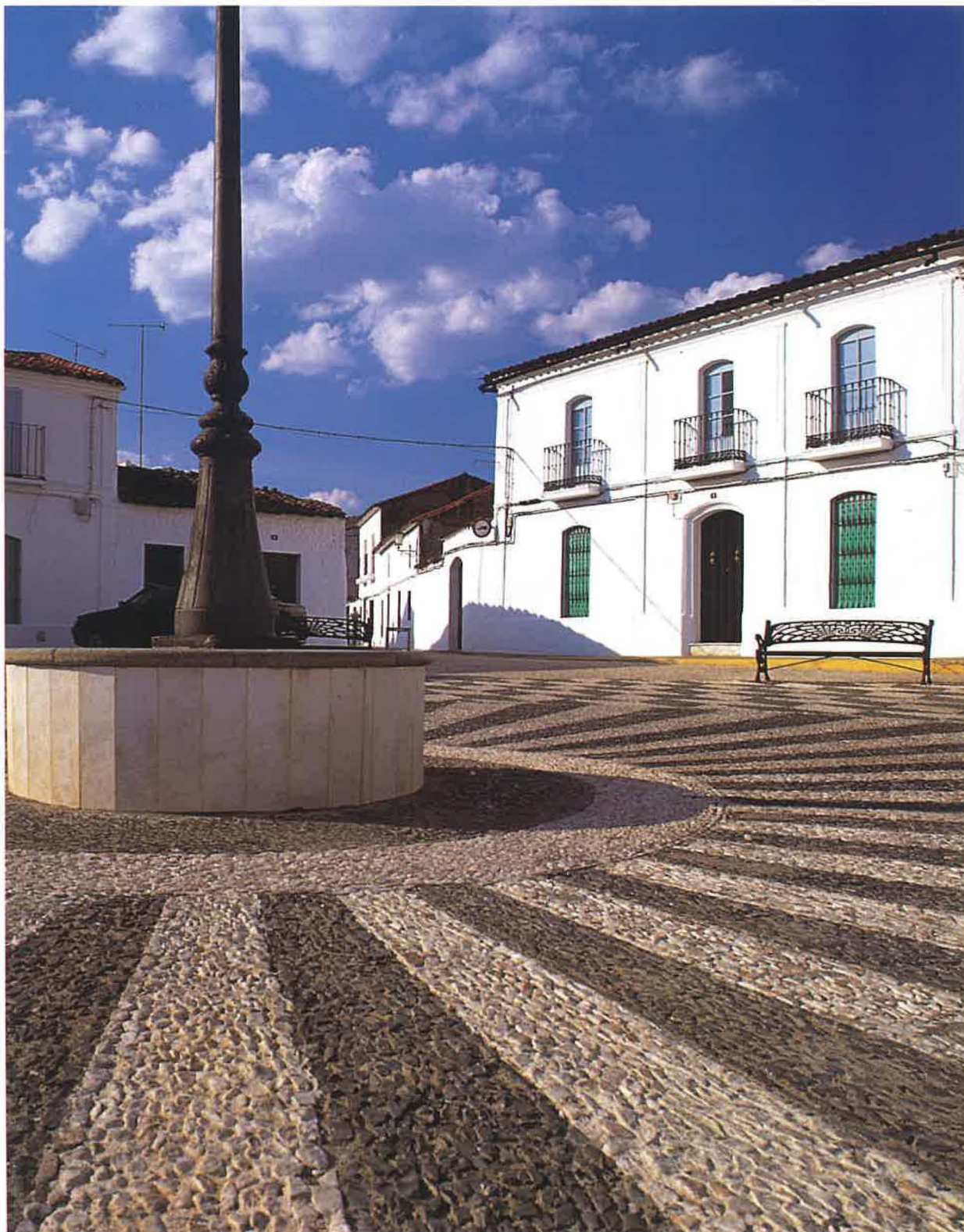
Cañaveral de León. Plaza de España.

En las Autonómicas andaluzas se dio una abstención del 37,34% de la población, un porcentaje importante. Los once escaños que correspondían a la provincia quedaron repartidos así: ocho para el PSOE/A que había recibido el 55,63% de los sufragios; dos para UCD, con el 18,69% del apoyo, y uno para AP con 12,64% de los votos. El PCE con algo más del 5% de