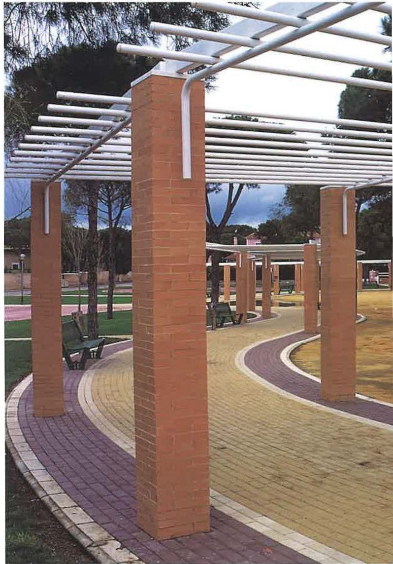
Ayuntamiento de Huelva.