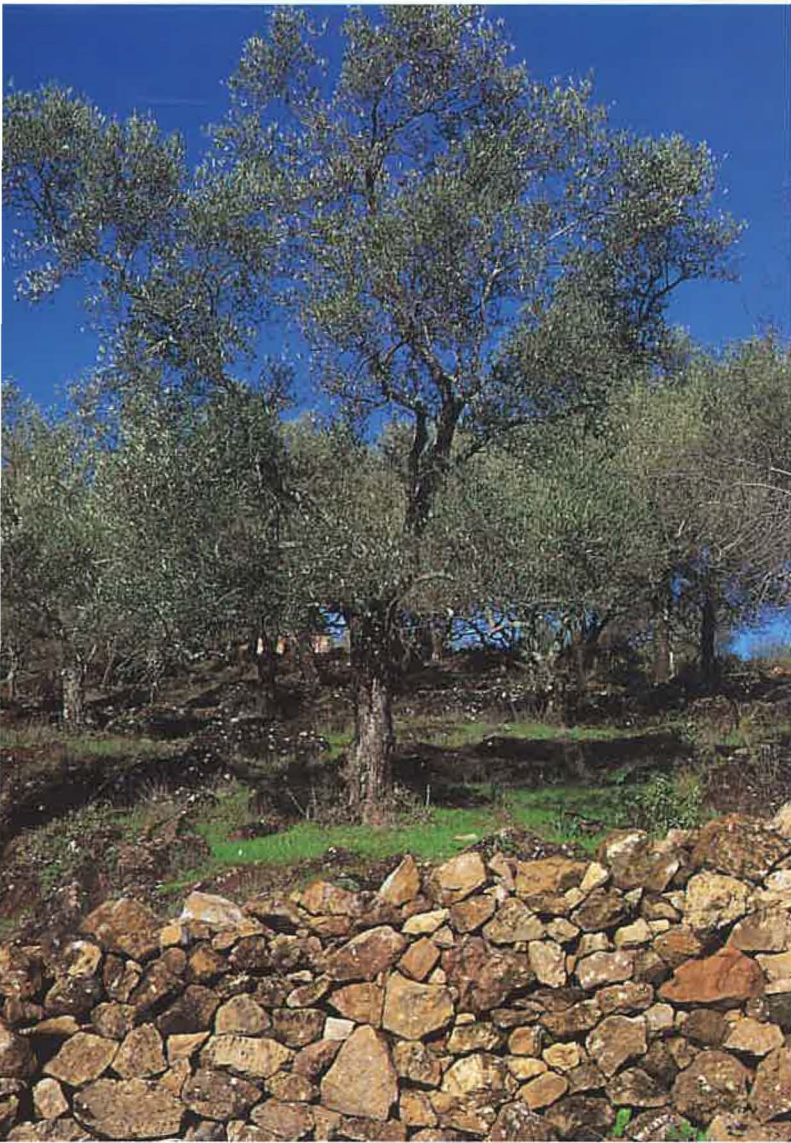
Cañaverall de León. Huertas en el valle.

porta hacia mataderos industriales de otras localidades, con la salvedad de un pequeño número destinado al autoconsumo en las tradicionales matanzas.