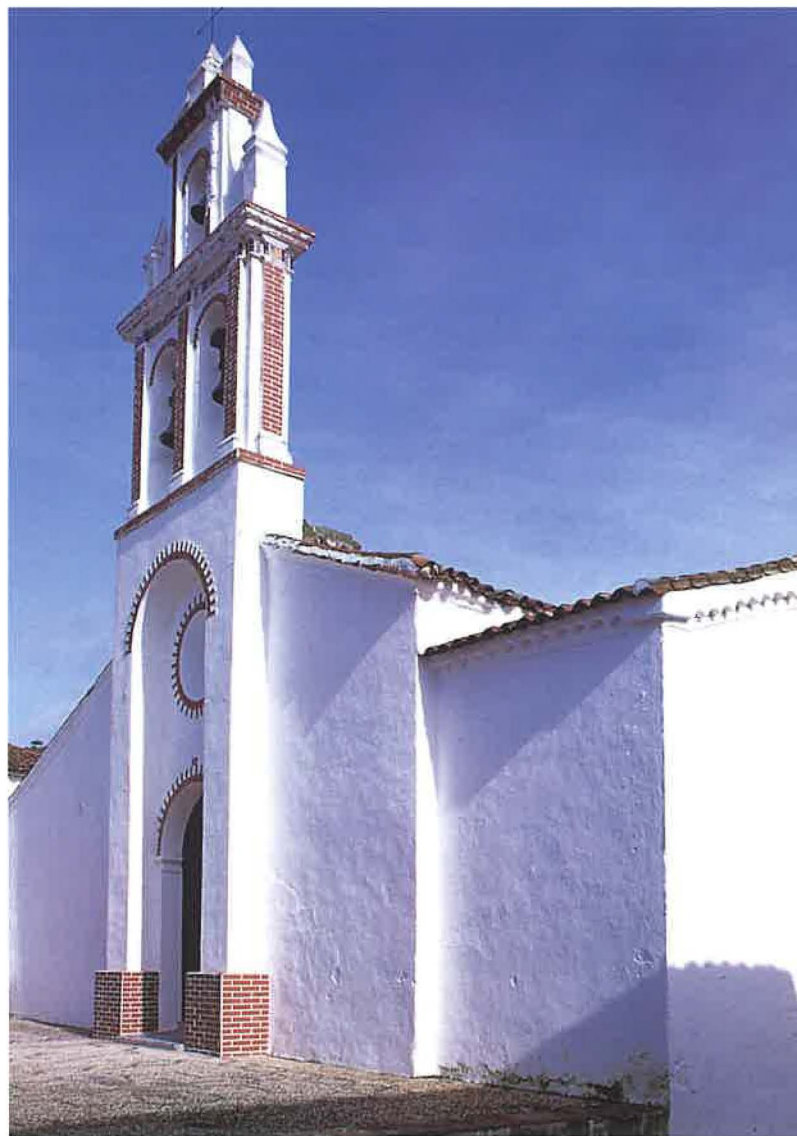
Iglesia de Santa Marina. Cañaveral de León.