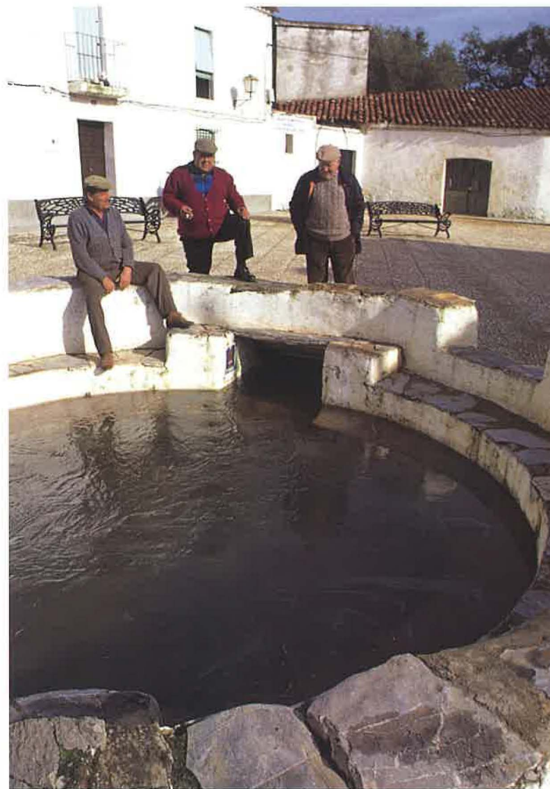
La Fuente Redonda en Cañaverall de León.