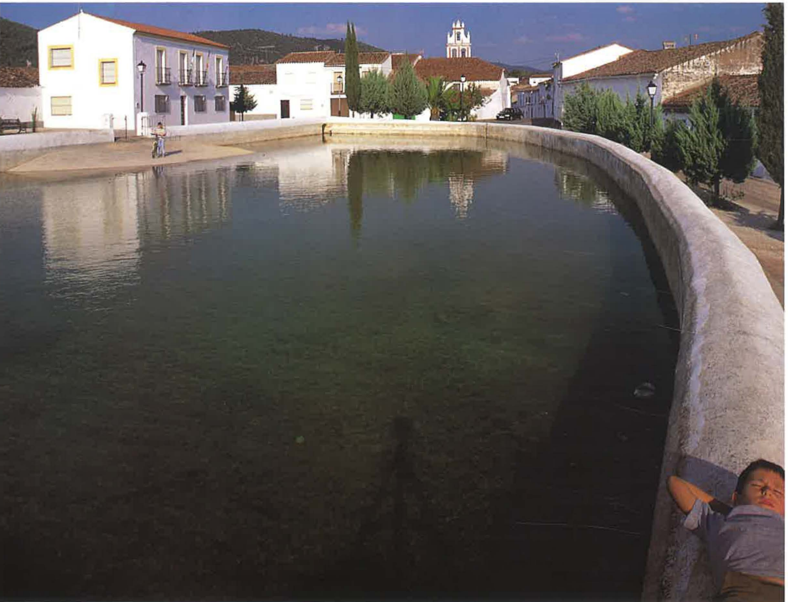
El “pantano” de Cañaveral.