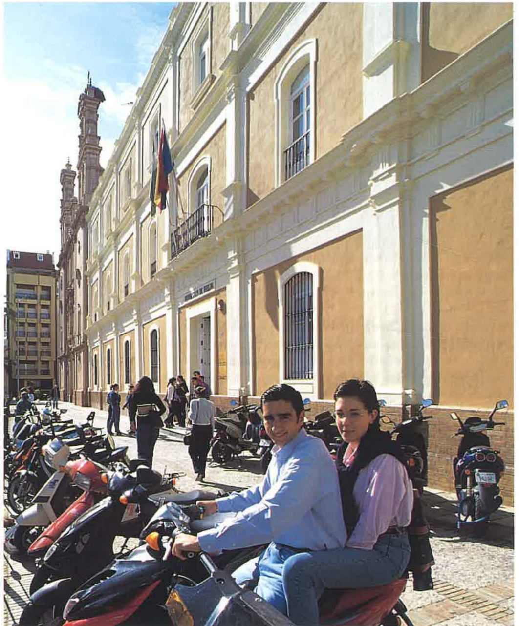
Universidad de Huelva.