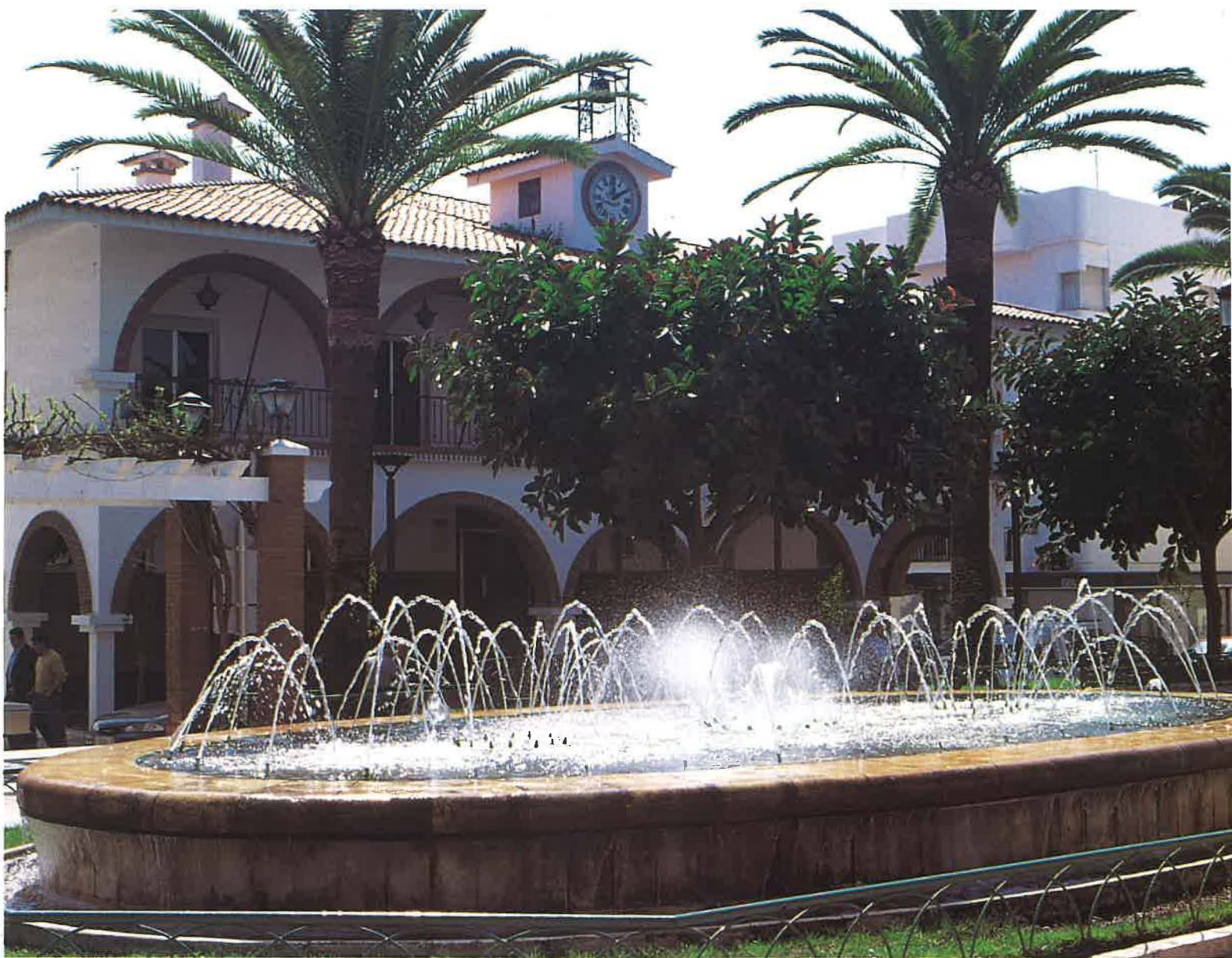
Ayuntamiento de Lepe. Mancomunidad de Islantilla.