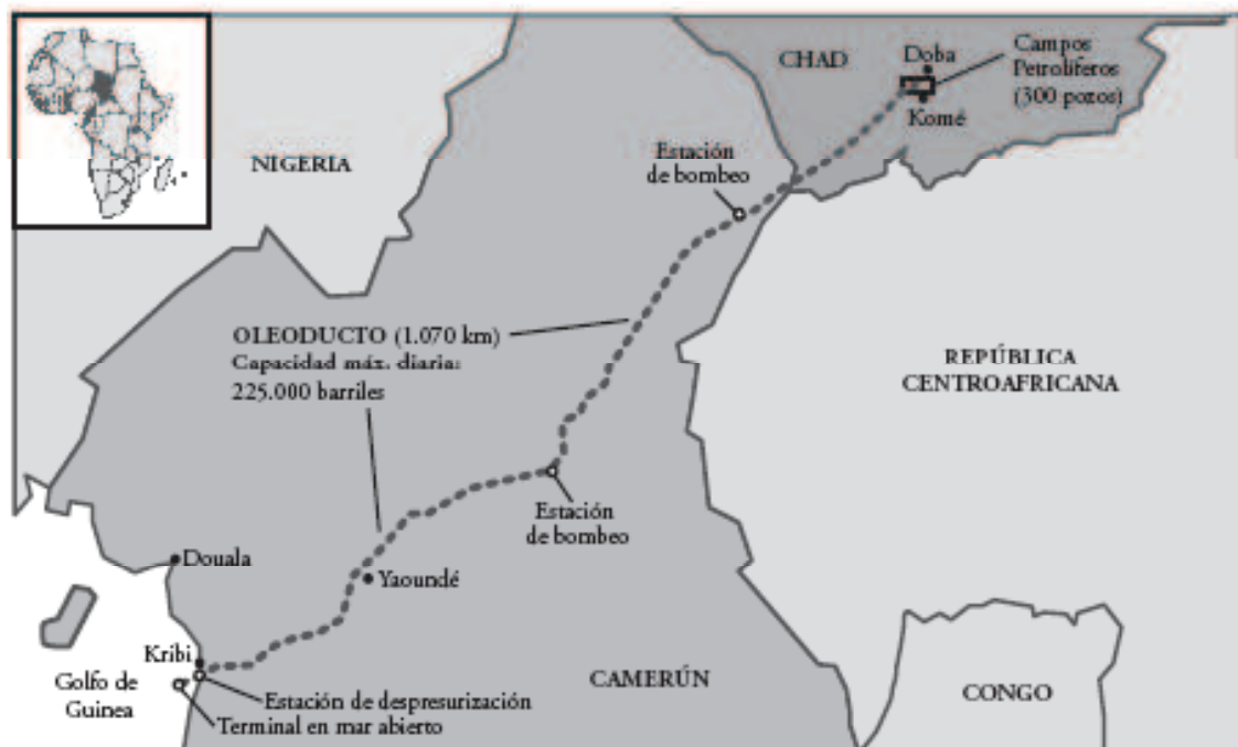
MAPA 1: EL OLEODUCTO CHAD-CAMERÚN