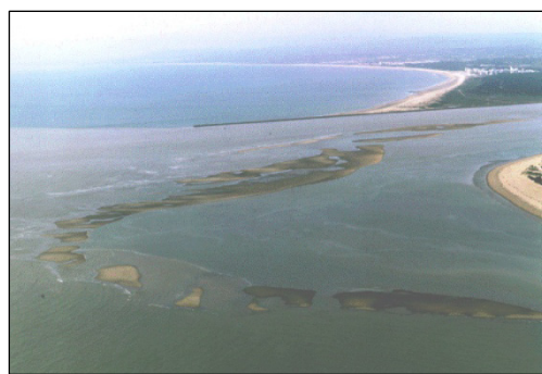
Figura 4. Panorámica de la Gola en 1996.