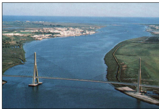
Figura 3. Tramo bajo del estuario del Gadiana.

Además del canal estuarino, las marismas de la orilla española están drenadas por el canal mareal del Carreras. En su desembocadura, también regulada por espigones el oleaje ha construido una flecha litoral utilizando la arena de los antiguos deltas mareales.