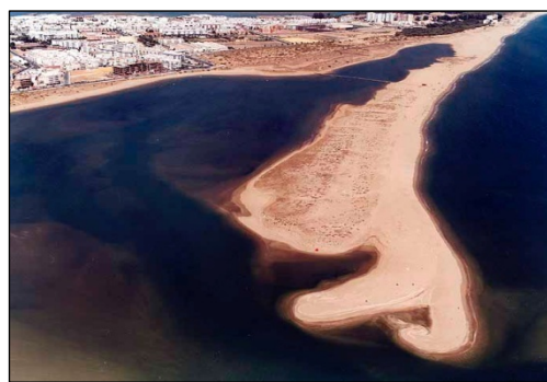
Figura 5. Nueva flecha litoral de Punta Caimán.