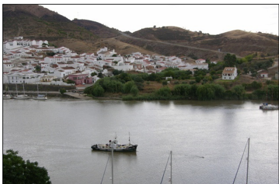
Figura 2. Sanlúcar de Gadiana (P1).