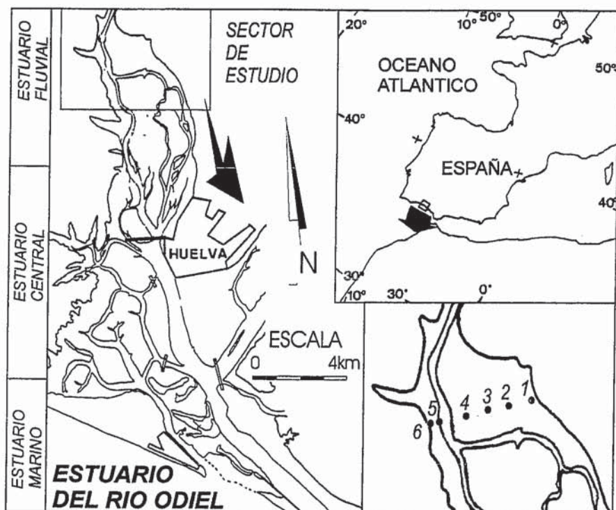
Figura 1.- Localización de la zona de estudio y de los sondeos utilizados.