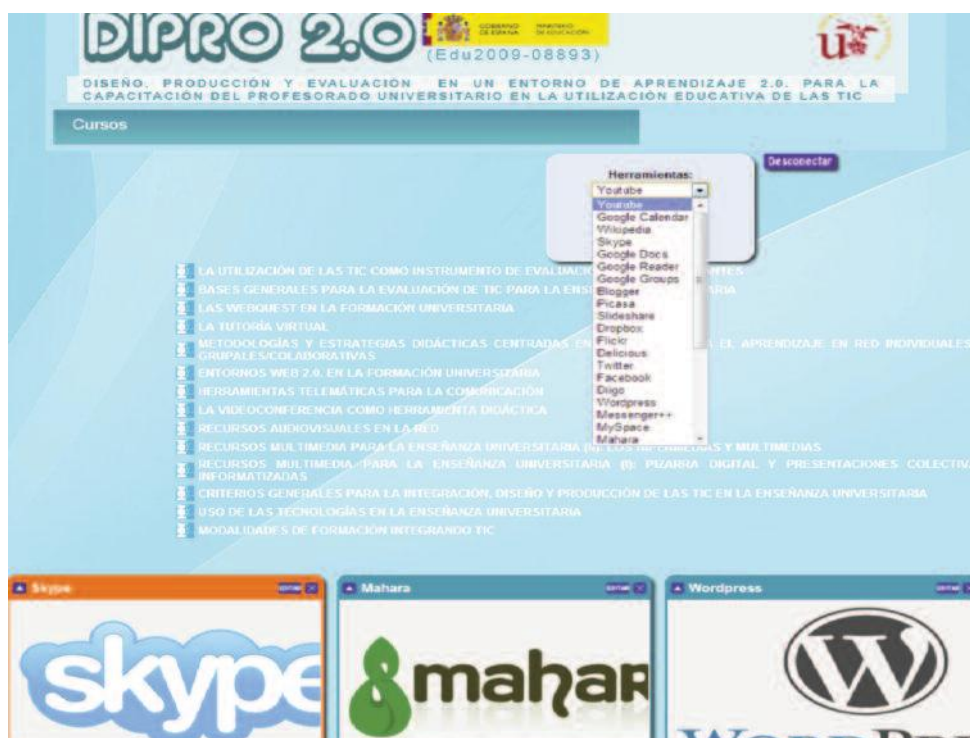
Fig. nº 2.- Imagen entorno Dipro 2.0.

Por lo que se refiere a los PLE nosotros a través de un proyecto de investigación denominado “Diseño, producción y evaluación de un entorno de aprendizaje 2.0 para la capacitación del profesorado universitario en la utilización educativa de las Tecnologías de la Información y Comunicación” (Dipro 2.0-EDU2009-08893), financiado por el Ministerio de Ciencia e Innovación (Cabero y otros, 2011; Infante y otros, 2013), diseñamos y producimos un entorno donde se combinaba un LMS (Moodle) con la posibilidad de configurar un entorno enriquecido con diferentes herramientas de la web 2.0. (fig. nº 2).