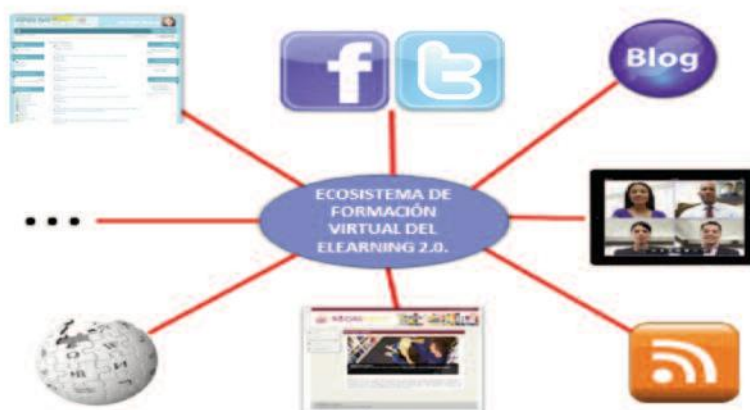
Fig. nº 1. Ecosistemas de formación virtual del e-learning 2.0.

El entorno que se creará, será desde un punto de vista mediático más variado que el elaborado para e-learning 1.0, que fundamentalmente se centrará en el LMS seleccionado y en las herramientas de comunicación sincrónicas y asíncrónicas que posea la plataforma. Por el contrario en el e-learning 2.0, el alumno interactuará en un verdadero ecosistema de formación virtual: blog, wiki, LMS, redes sociales,... (fig. nº 1).