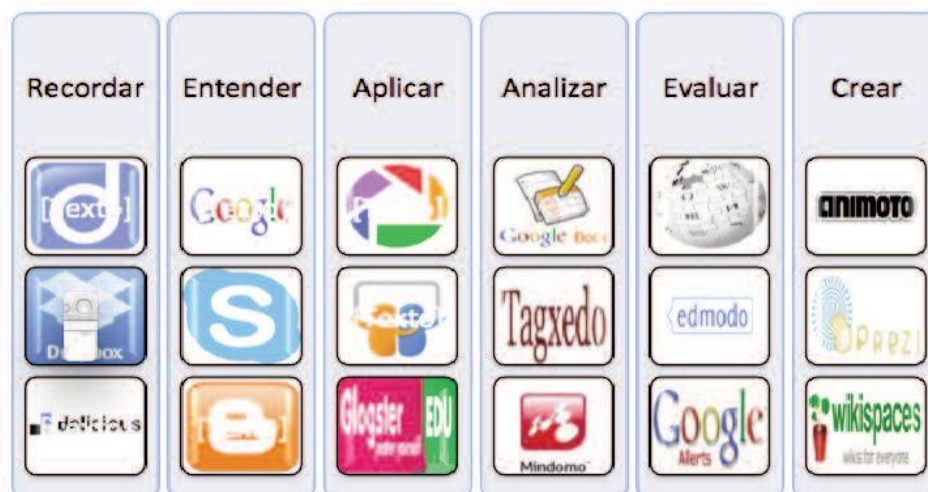
Fig. nº 4. Ejemplos de App asociadas a diferentes categorías de la taxonomía de Bloom.

combinan los elementos estructurados del aprendizaje formal, la naturaleza autodirigida del empleo informal del aprendizaje y las tecnologías nuevas y poderosas de la web 2.0 para apoyar las necesidades de formación de la persona en su viaje de aprendizaje personal (Schlenker, 2008).