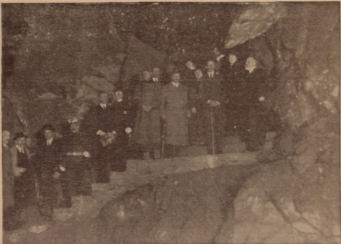
Los Reyes y su séquito en el interior de la Gruta

Los concurrentes oyeron complacidos las manifestaciones de la presidencia y aprobaron lo propuesto por la misma, así como el mensaje que se dirige a S. M., que todos autorizan con su firma. También se acordó por unanimidad, y a propuesta de varios señores socios, conceder