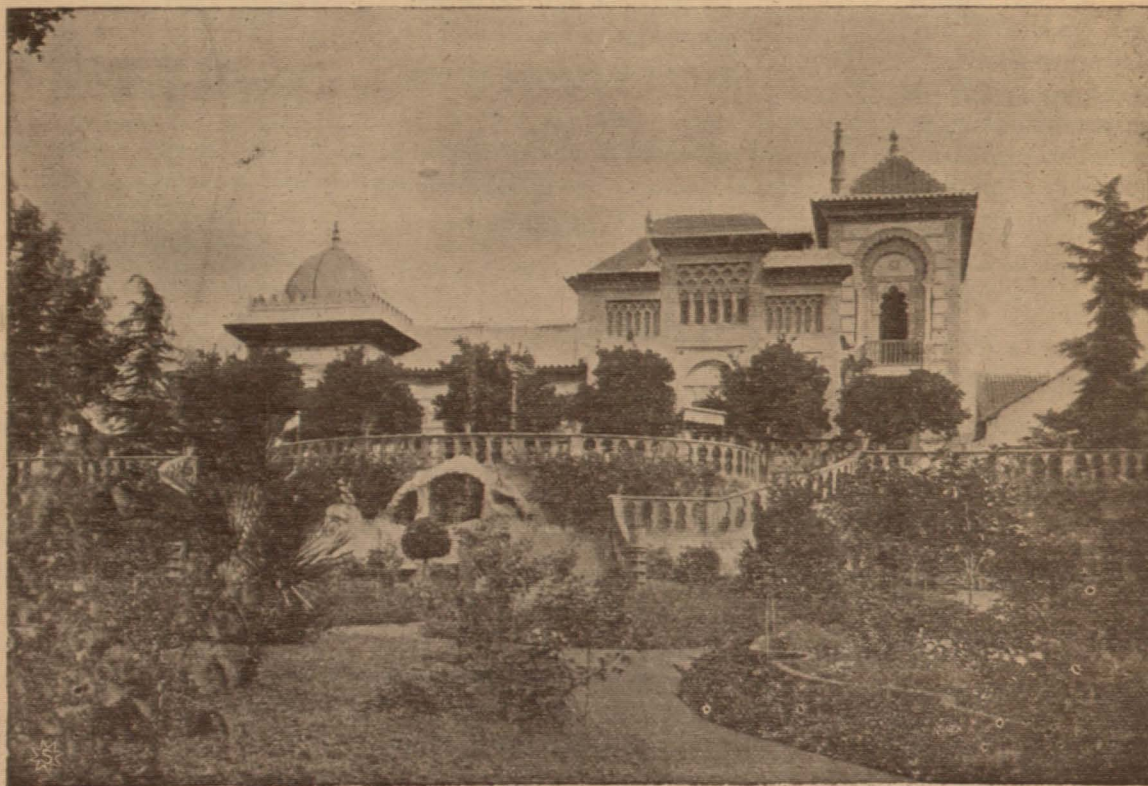
"Quinta de San Miguel", donde almorzaron SS. MM. y AA. RR.

La instalación de las «zonas neutrales» nos recuerda las teorías de Henri George, por lo mismo que los terrenos donde