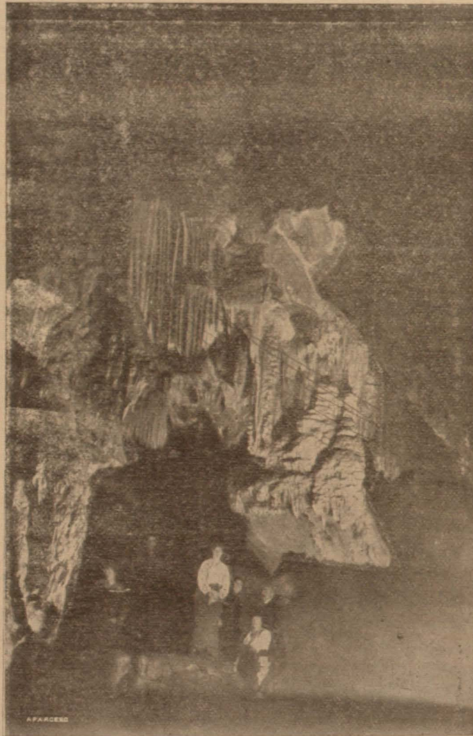
Un aspecto de la Gruta de las Maravillas visitada recientemente por sus Majestades y Altezas Reales

Pudiera ser que nos engañase un fenómeno de espejismo y que la labor sólo hubiese formado un castillo de ilusiones; pudiera ocurrir que viviésemos en una idealidad engañadora y que la ac-