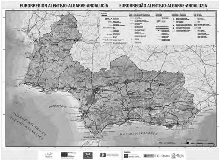
Figura 1. Ámbito territorial de la Euroregión Alentejo-Algarve-Andalucía (AAA).

Con las reformas normativas de estos programas, estos fondos estrictamente fronterizos se empiezan a destinar a unos territorios operativos muy amplios, que no son partícipes de la singularidad territorial y humana de los espacios de frontera. De esta manera, desde 2007 el espacio de cooperación llega hasta las cercanías de Madrid o Lisboa y engloba en la actualidad (marco 2021-2027) una superficie de 253.466 km 2 y una población de 16,6 millones de personas en 2021, lo que supone el 42,3% y el 28,8%, respectivamente, de ambos estados ibéricos.