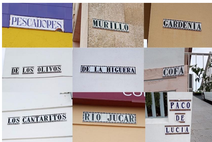
Imagen 4. Selección de odónimos de zonas tematizadas que remiten a artistas, profesiones y elementos naturales o geográficos.

Esta forma de planificación onomástica evidencia, además, un desplazamiento en la función social de los odónimos. Mientras que en las denominaciones tradicionales el nombre remitía a un uso, a un referente inmediato o a una memoria compartida, en los nuevos desarrollos urbanos el vínculo entre el odónimo y la experiencia cotidiana del lugar es más débil. El paisaje lingüístico resultante es, por tanto, más homogéneo y sistemático, pero también menos anclado en la historia local y en las prácticas sociales específicas del territorio, lo que refuerza su carácter institucional y abstracto. Si bien es cierto, este esquema se abandona cuando se hace necesario; recientemente por acuerdos en plenos municipales se está llevando a cabo prácticas de reconocimiento y homenaje coincidiendo con el Día de Andalucía, todas a personas de la localidad o con estrecha vinculación con esta.