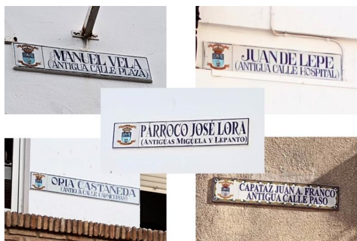
Imagen 2. Rótulos actuales con los odónimos contemporáneos y primitivos.

Junto a estas transformaciones institucionales del conjunto de denominaciones resulta relevante considerar la persistencia de determinados odónimos en el uso cotidiano de la ciudadanía, incluso después de haber sido oficialmente sustituidos por motivos políticos o culturales. En numerosos casos, los hablantes continúan refiriéndose a calles y espacios urbanos por sus denominaciones anteriores, lo que pone de manifiesto que la odonimia no se agota en su dimensión administrativa, sino que forma parte de un sistema de referencias compartidas y de un sentido de pertenencia construido a lo largo del tiempo. Desde la perspectiva del paisaje lingüístico, esta coexistencia entre el nombre oficial y el nombre vivido evidencia la tensión entre las políticas de denominación «desde arriba» y las prácticas lingüísticas «desde abajo»,