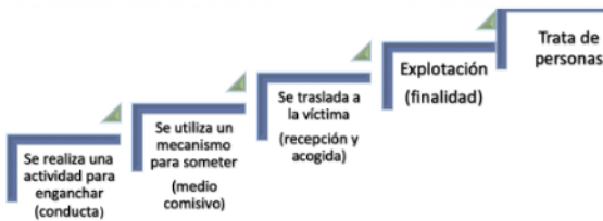
Figura 1. Conductas que intervienen como medios en la trata de personas

De lo anterior se desprende que no es necesario que se consuma la explotación para que el delito se configure, sino que este se desarrolla desde el momento mismo en que la víctima es enganchada, independientemente de que se explote o no. Lo anterior significa que se trata de un delito de emprendimiento o preparación en donde aparentemente distintas conductas son independientes de una misma actividad ilícita; no se castiga como una acción ilícita particular, sino como una actividad que se compone de distintas conductas (Noriega Saes y Huitron García, 2019), en las que se retiene a una persona, se somete y finalmente se explota.