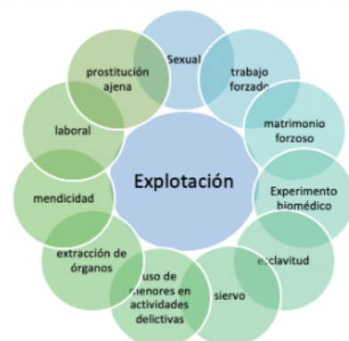
Figura 3. Conductas delictivas de explotación de víctimas