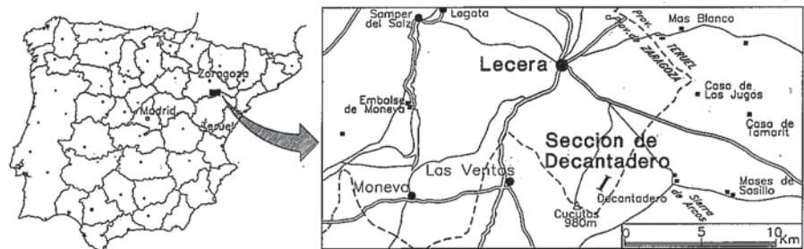
Fig. 1.- Mapa de situación de la sección de Decantadero.

Al sur-sureste de Lécera, en la sección de Decantadero, se encuentra una sucesión inusual en los afloramientos de la Cordillera Ibérica, que presenta la particularidad de mostrar inmediatamente por encima de la Formación Imón (Goy et al. , 1976) un potente tramo evaporítico con intercalaciones de carbonatos. Estos materiales se definen ahora como Formación Yesos, anhidritas y carbonatos de Lécera y pueden ser considerados equivalentes en parte de la "Anhidrita de Carcelén" (Ortí, 1990) reconocida en nu-