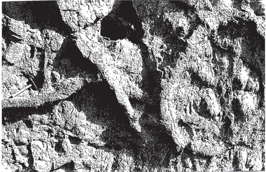
Fig. 4.- Detalle del afloramiento de las icnitas de Bueña (Teruel).

Fig. 4.- Detail of outcrop of de trace fossils from Bueña (Teruel).