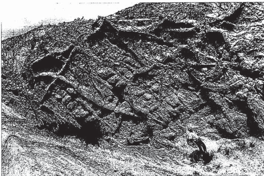
Fig. 3.- Vista general del yacimiento de Megaplanolites ibericus .