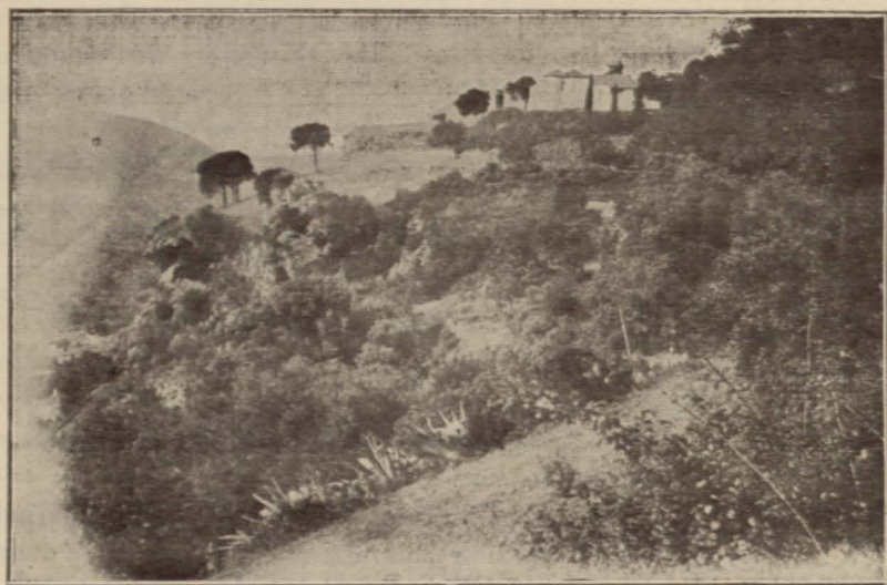
ALAJAR.—La Peña de Arias Montano

incansable es funestísima y su número es tal que en todas las sendas por donde busquemos nuestro mejoramiento hemos de encontrarlos como enormes peñascos cerrando el paso a las más legítimas aspiraciones.