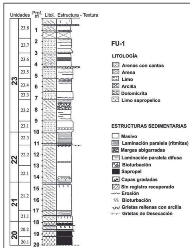
Fig. 2.- Stratigraphic section of the first 20 m of FU-1 core.

Unidad 20 (20 a 18,20 m): Limos sapropélicos de color negro, fétidos, masivos y ligeramente laminados.