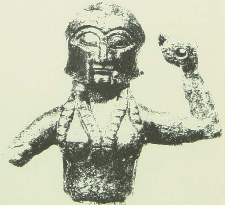
FIGURA 3. Afrodita armada de Gravisca (M. Torelli, op.cit. , "Il Santuario...", fig. 11)