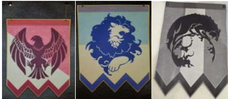
Figura 3. Estandartes de las tres casas. Estandartes de elaboración propia a partir de los diseños del videojuego Fire Emblem Three Houses (2019) de Nintendo Switch.