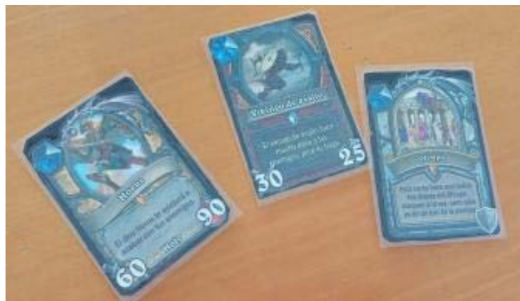
Figura 8. Cartas Civilizations. Elaboración propia a través de http://www.hearthcards.net