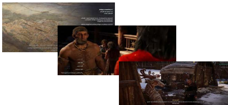
Figura 4. Assassin's Creed: Discovery Tour en juego (Ubisoft). Aquí se presentan algunas pantallas de lo trabajado con realidad virtual en el aula. Tomado de Ancient Egypt Discovery Tour (2017), Ancient Greece Discovery Tour (2019) y Viking Age Discovery Tour (2021) de Ubisoft.