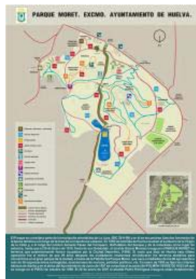
Figura 6. Mapa del Parque Moret Huelva.