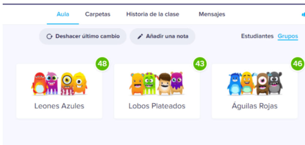
Figura 2. División de clase por casas en ClassDojo. Pantalla de la aplicación para la gamificación ClassDojo donde muestran los tres grupos con sus respectivas puntuaciones.