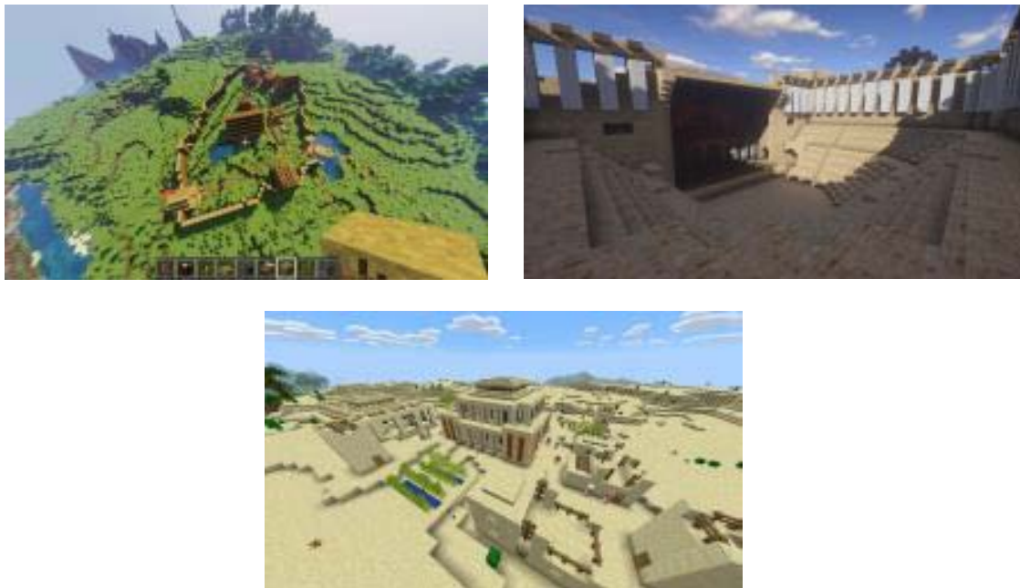
Figura 5. Construcciones de Minecraft elaboradas por los estudiantes.