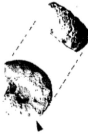
Fig. 2. — Superficie ferruginizada a techo del nivel condensado. Flecha indicando la presencia de Sutneria platynota (Reinecke).