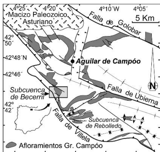
Fig. 1.- Mapa de afloramientos del Grupo Campóo en la Cuenca de Aguilar.

Fig. 1.- Outcrop map of the Campóo Group in the Aguilar Basin.