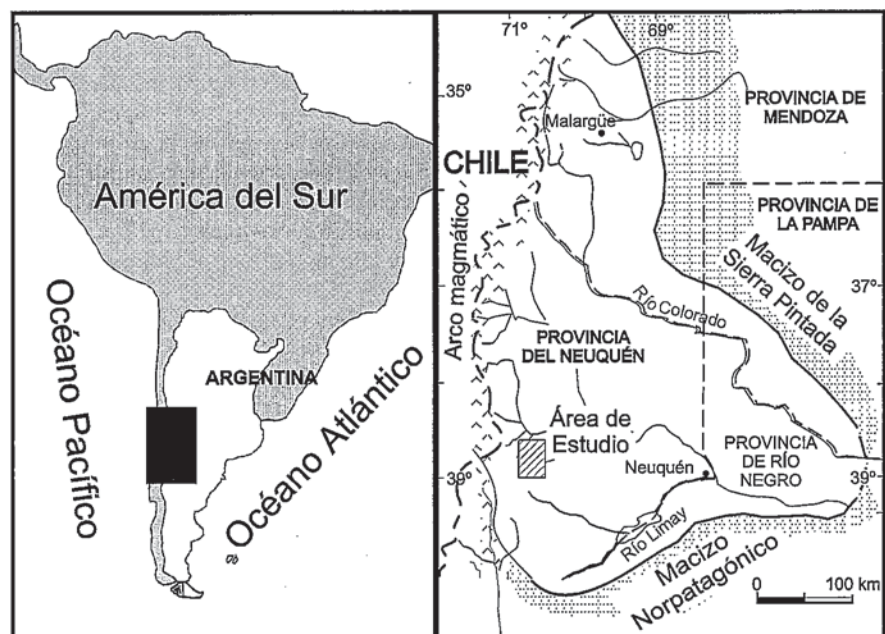
Fig. 1.- Situación del área estudiada

Durante el Kimmeridgiense la cuenca Neuquina fue ocupada casi enteramente por depósitos continentales conocidos como Formación Tordillo. Esta unidad